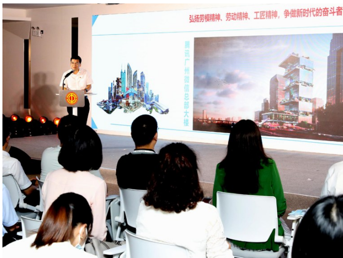
2022年6月23日，“中国梦·劳动美——喜迎二十大 建功新时代”2022年劳模工匠进校园活动暨纪录片《南粤工匠》开机启动仪式举行。