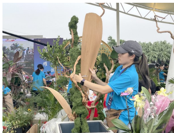
花木技能竞赛。