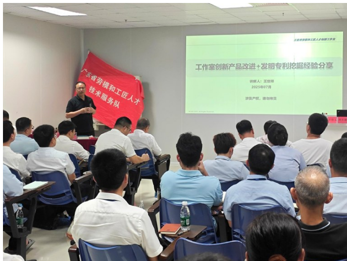
2025年5月,省总工会部署实施“劳模工匠进万企 助力现代化产业体系建设”专项行动。图为7月,汕尾市总组织劳模工匠深入企业实地把脉授课。