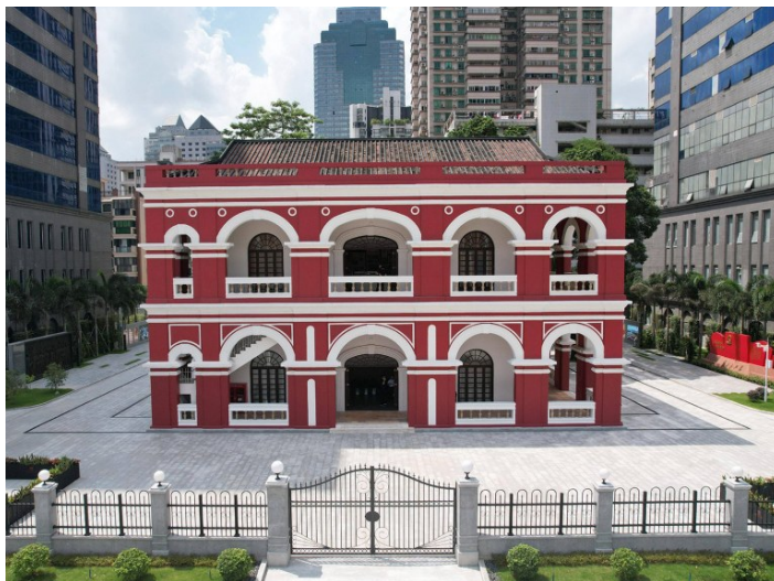
省总推动多处红色工运场馆修缮提升。图为2021年9月1日，省港罢工委员会旧址经修缮升级后全新亮相。