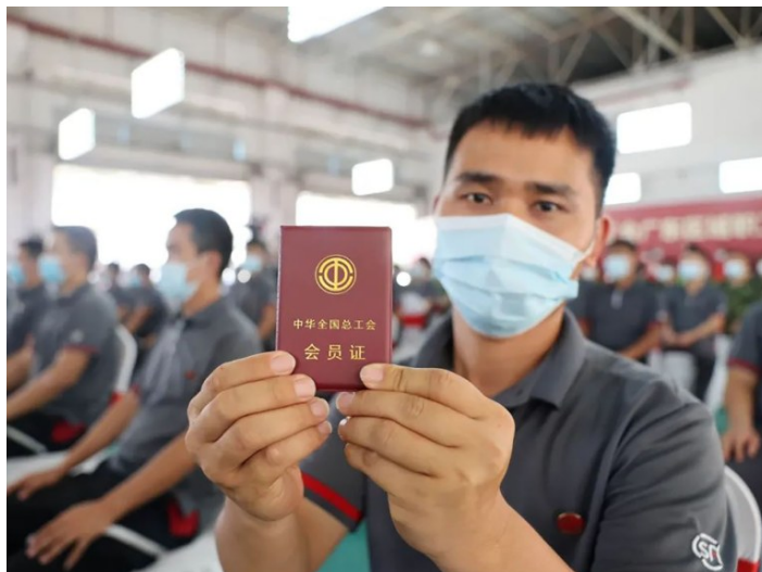
2021年9月9日，1万多名顺丰集团快递员在省总工会、东莞市总工会见证下正式成为工会会员。

子、工会志愿者等队伍，成为基层工会重要工作力量。2023年，阳江市总举办职工心理健康服务技能比赛，提升职工心理健康服务队伍的专业能力水平。2023年，深圳市总探索全面加强以感知力、响应力、影响力、凝聚力为核心的中国式现代化工会组织能力建设，形成“金字塔”式线下组织体系和扁平化线上服务体系互为补充、协同配合、全面覆盖的职工维权服务网络，不断提高工会助力高质量发展本领、服务职工群众本领、防范化解风险本领。