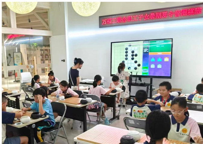
宝安万福社区的职工子女夏令营围棋班。

与社会贡献,编辑出版《宝安工匠风采录》,开设《宝安劳模工匠全媒体深度访谈》,开展“百名劳模工匠献礼百年工运”专题活动。