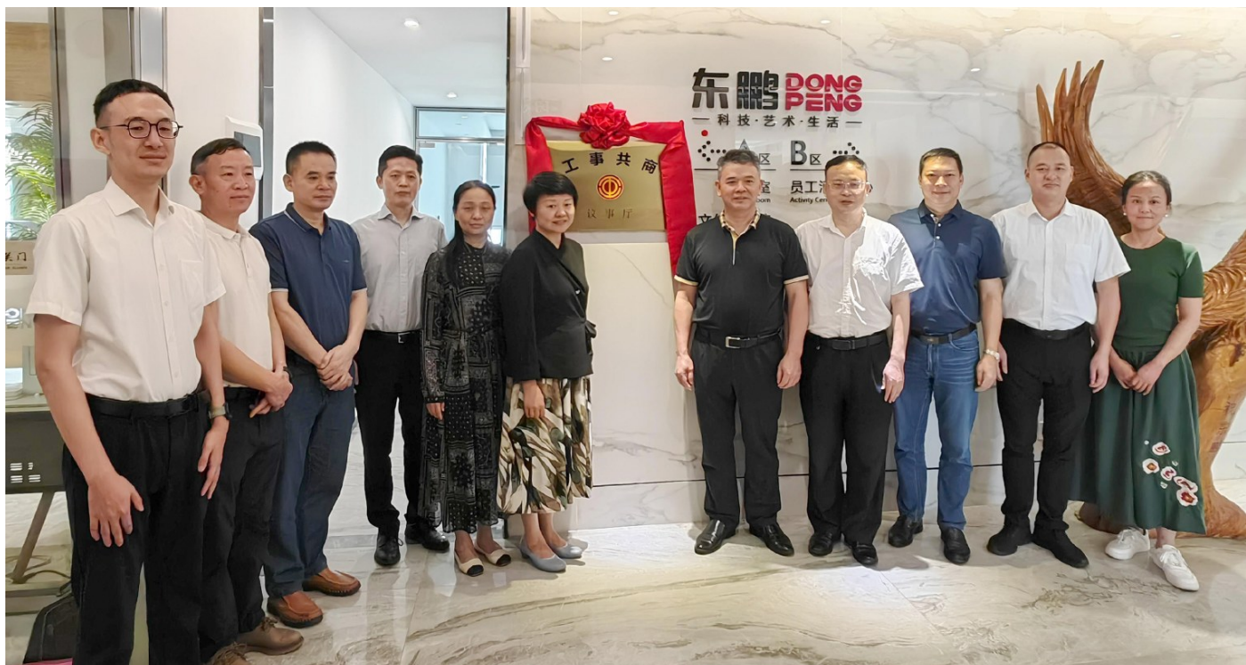
2024年6月,佛山市东鹏陶瓷发展有限公司的“工事共商”议事厅揭牌。