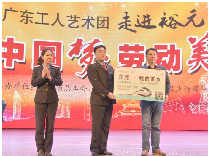
2015年1月10日晚,“中国梦·劳动美”广东工人艺术团成立后的首场慰问演出,走进东莞市高埗镇的裕元集团。