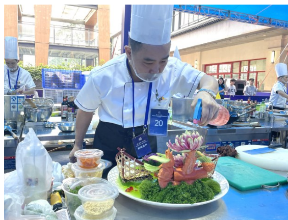
中式烹饪师竞赛。