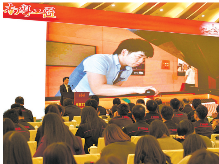
2016年,首届南粤工匠评出,图为该年12月15日,南粤工匠先进事迹报告会在广州举行。

村疗休养、工会消费帮扶等举措,有效带动乡村文旅消费、“百千万工程”农特产品销售,引导各级工会和广大职工投入更多资源力量、助力城乡区域协调发展。这些实践通过深化制度改革,充分释放工会自身组织优势、群众优势、资源优势、制度优势和协同优势,体现出工会在服务中心大局中的独特作用和价值。