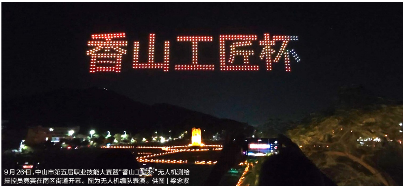
9月26日,中山市第五届职业技能大赛暨“香山工匠杯”无人机测绘操控员竞赛在南区街道开幕。图为无人机编队表演。