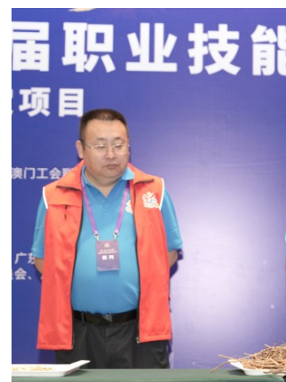
中药材鉴定。摄影 | 林景余