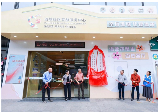
10月,西乡街道中心工会联合会,成为宝安区第18家先行示范工会。