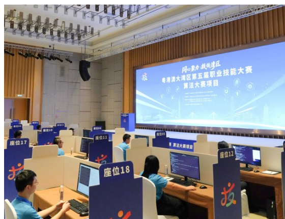
算法大赛。

粤港澳共派出12支代表队参赛。大赛创新采用“四城协同、八赛并举”的赛制,参赛人数与项目数量均达 历届之最 。大赛持续至11月,共有200多名优秀选手同台竞技。