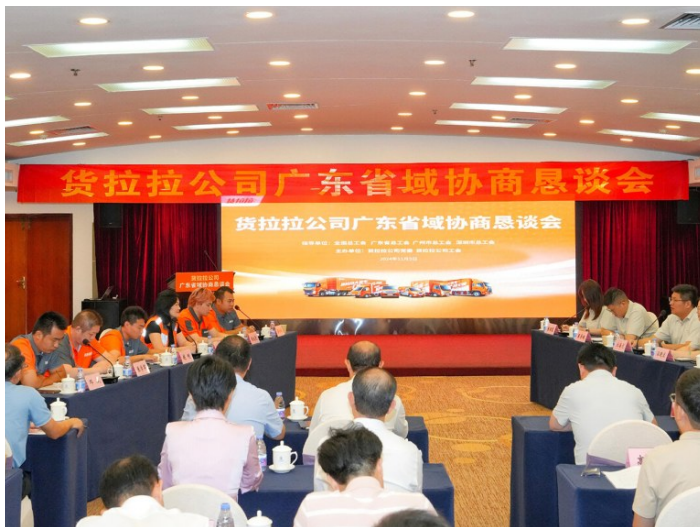
2024年11月5日,在省总工会指导下,深圳依时货拉拉科技有限公司工会在广州召开货拉拉公司广东省域协商恳谈会。