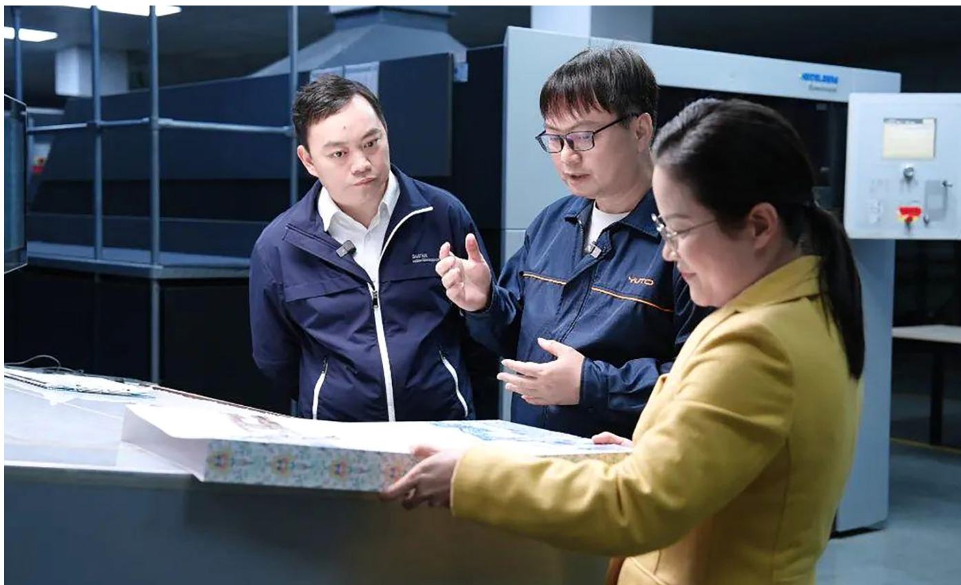
宝安区总工会携手宝安融媒策划推出了《宝安劳模工匠全媒体深度访谈》节目。资料图片