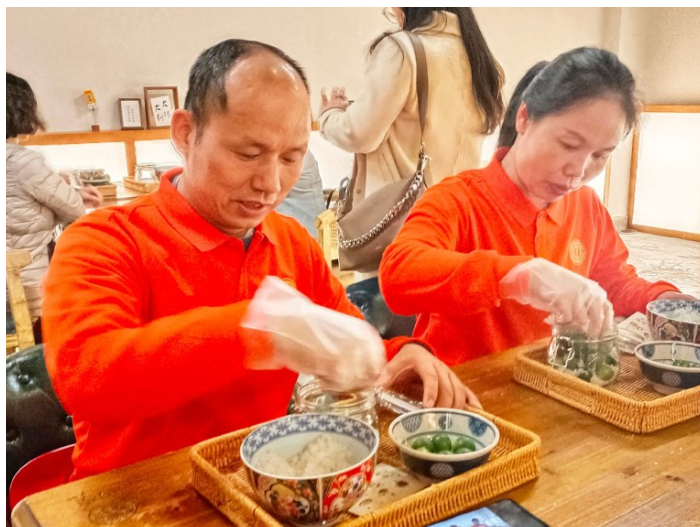
2023年12月5日，广东工会助力“百千万工程”职工乡村疗休养活动启动，图为职工在疗休养活动中体验制作咸桔。