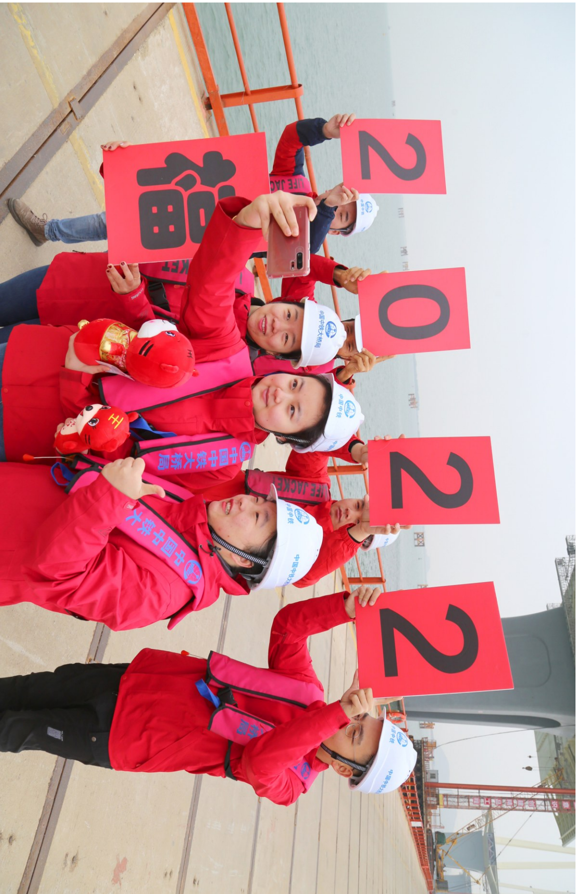
工地年味儿浓