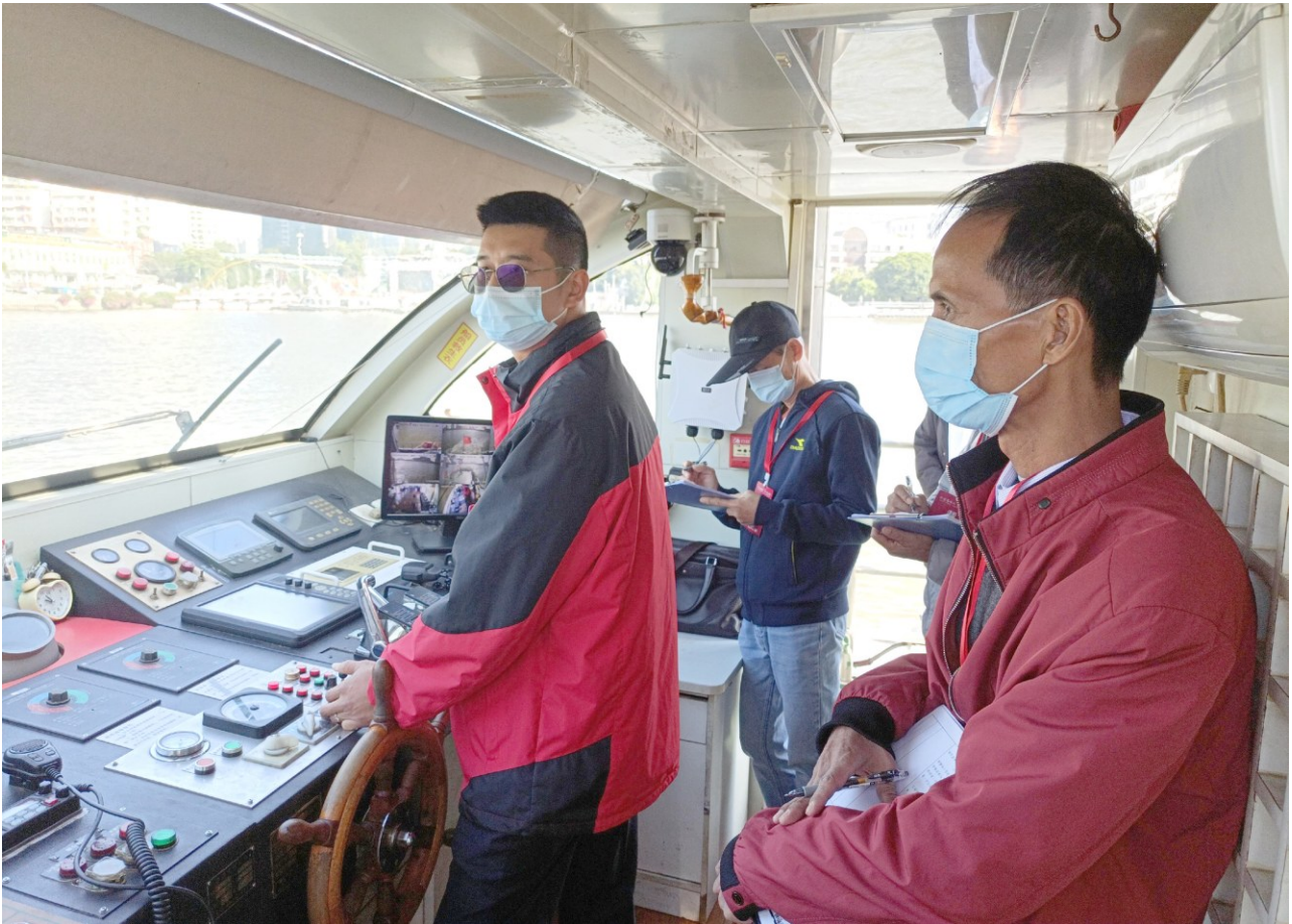
2021年12月1日,“羊城工匠杯”2021年内河船员职业技能竞赛在广州举行,108名内河客船选手同台角逐。

中船员发展规划建议由省政府职能部门牵头,出资集聚行业内专家及产学研多方智慧,推出鼓励船员长远可持续发展的措施,补齐广东船员发展短板。