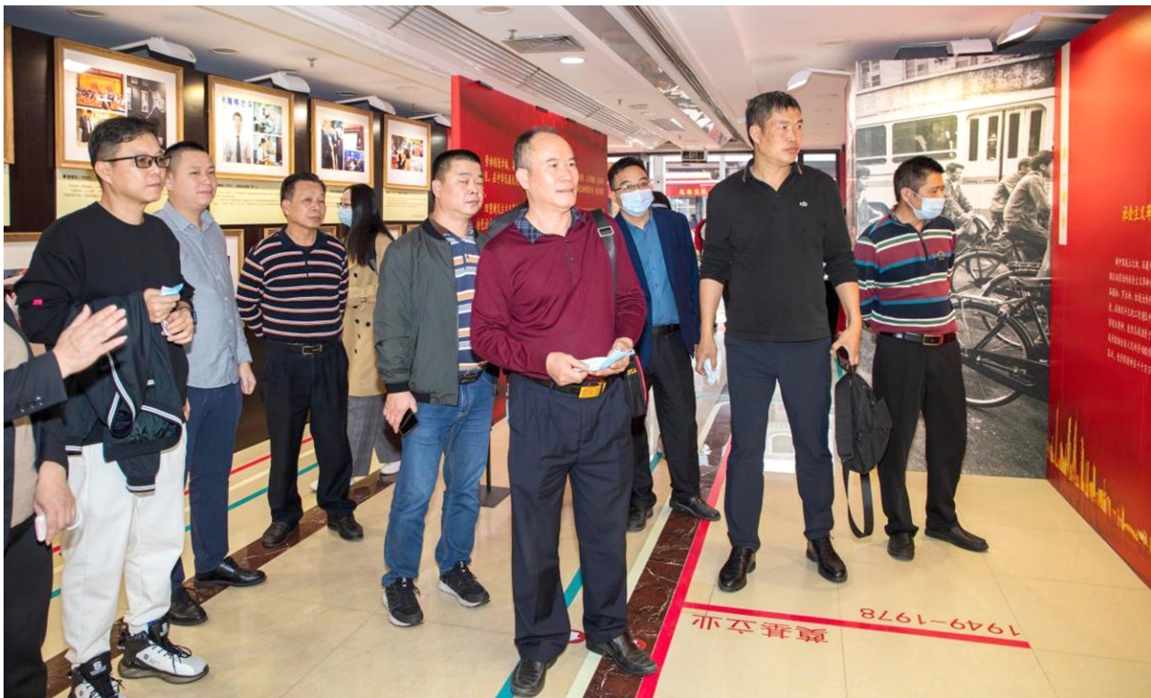
1月6日,阳江市总工会组织各县(市、区)总工会和各级劳模代表来到广州市工人文化宫,参观“中国梦·劳动美——永远跟党走 奋进新时代”广东省百名劳模图片展。

场经济的负面影响。个别意志不坚定的劳模工匠党员价值观念发生扭曲,追求享乐,有的甚至走上违纪违法的道路,损坏了劳模工匠队伍特别是党的形象。