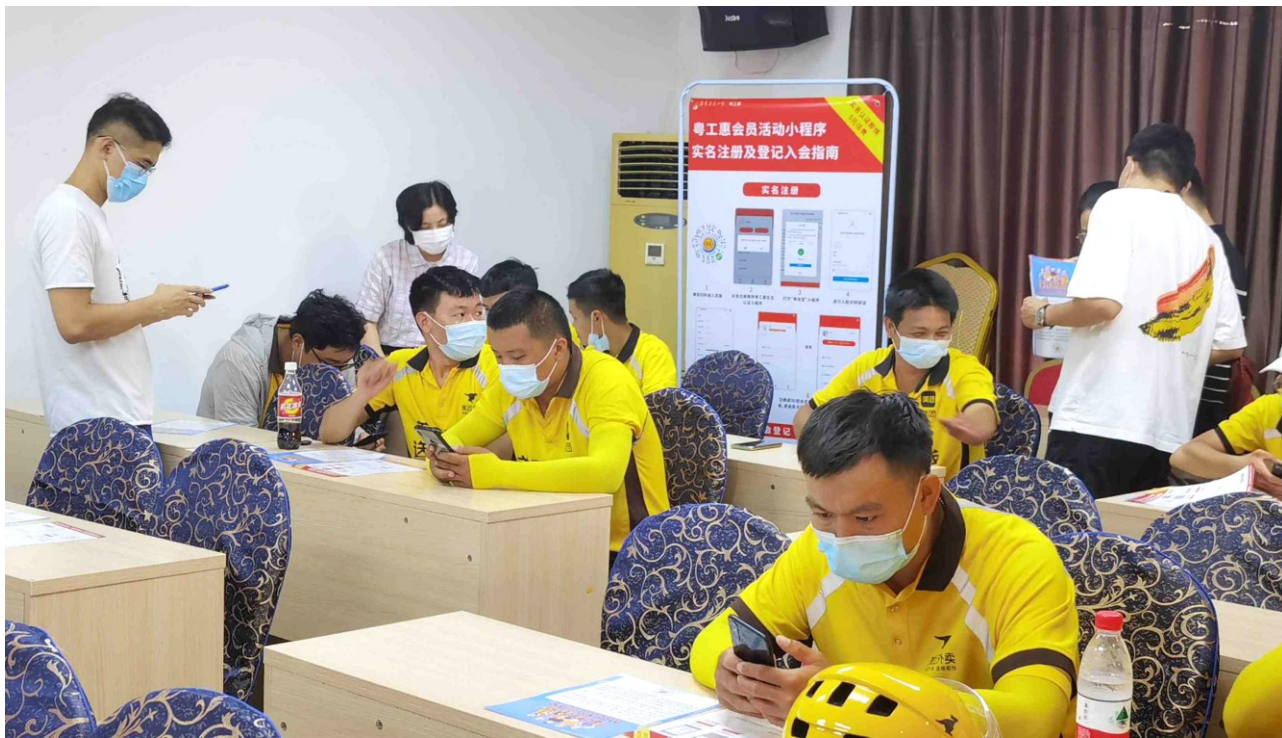
湛江工会干部现场指导美团配送员实名登记入会并参与线上活动