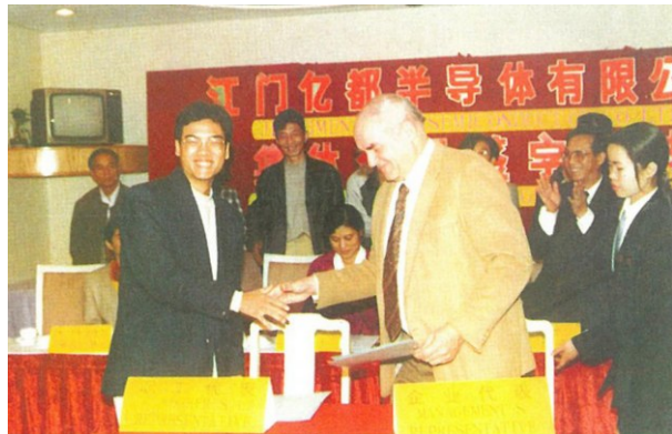
↑ 江门市第一家外商投资企业——江门亿都半导体有限公司签订集体合同。