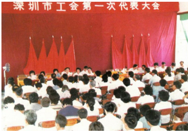
↑ 1984年6月,深圳市工会第一次代表大会。

到1985年,深圳经济特区吸收了世界19个国家和地区9.32亿美元的外资和3万多台(套)的技术设备,建立了包括电子、轻工、纺织、食品、建材、石化、机械等行业在内