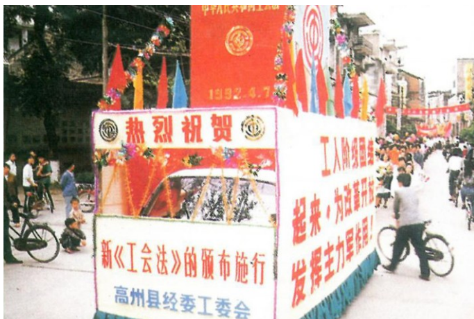
1994年,高州市职工群众宣传新《工会法》。