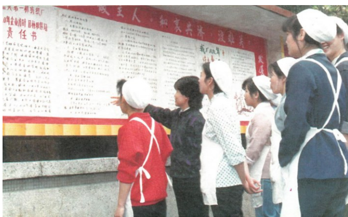
1990年,韶关市第一棉纺厂民主管理落实措施。