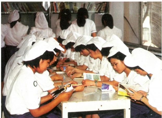
↑ 汕头经济特区东京元件的女工在业余时间阅读。

□文/中共广东省委党史研究室《中共广东历史简明读本》