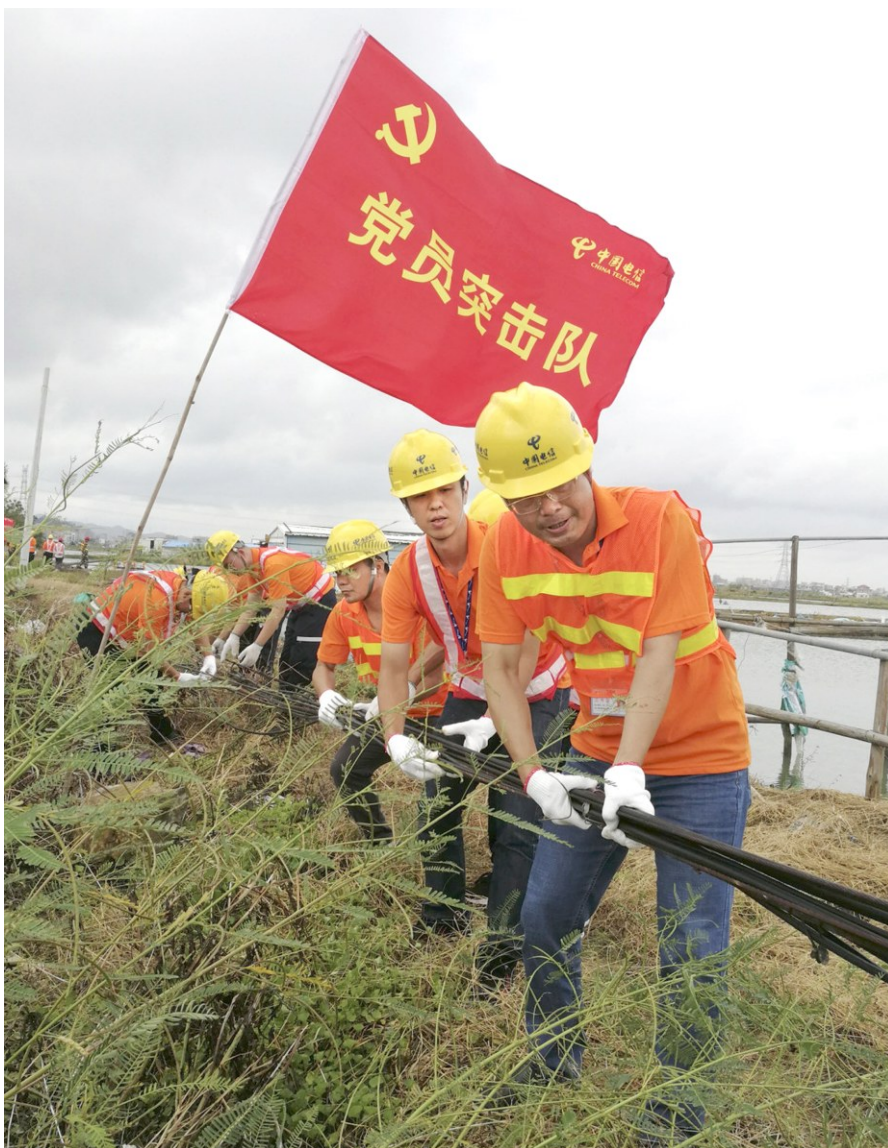
《抗灾一线》手机组银奖