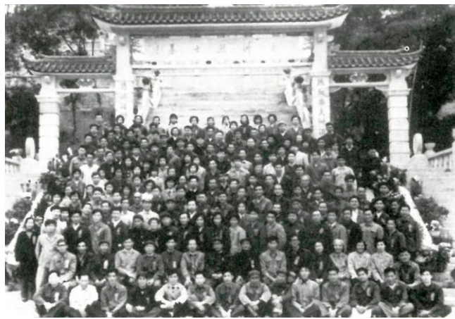
↑ 1980年2月,珠海市工会第一次代表大会。