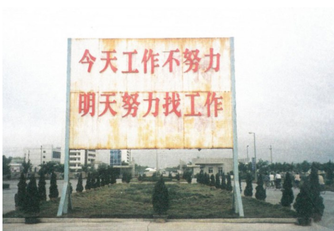
④ “今天工作不努力，明天努力找工作。”成为茂名乙烯工人新的工作口号。