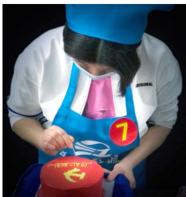
《祝：中国共产党100岁生日快乐！》 手机组银奖