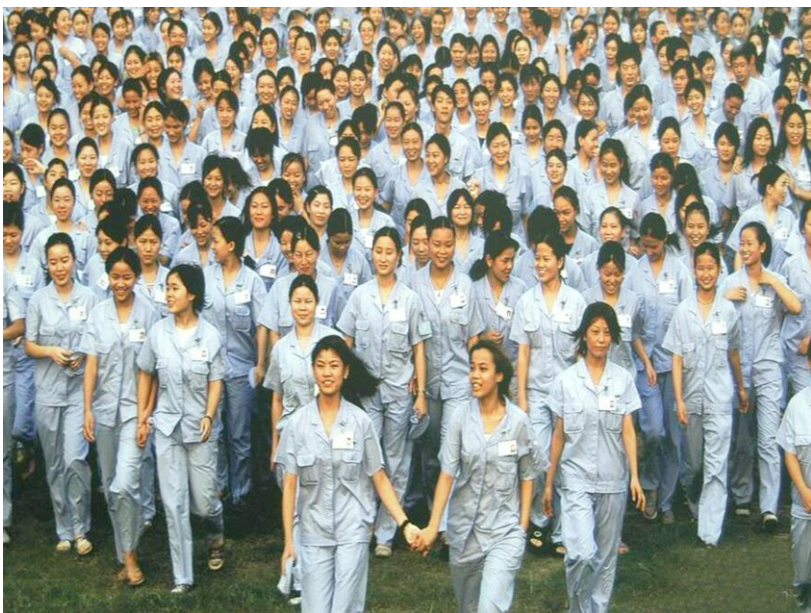
深圳蛇口工业区的女工

李亚罗回忆,尉健行对当时蛇口工业区的工会工作有着深刻分析。“在他看来,要求企业工会很有活力、维护职工合法权益很有胆识、很有水平,对许多企业工会来说,还做不到。因为企业工会主席都是兼职的,受到企业行政的制约。他们从人员、时间、能力等各方面都没办法把维护职工合法权益做好,这一点要理解。如果我们一定要求他们做到位,这是对他们的苛求。但是基层做不好并不意味着工会不维权,而是要求上级工会来代替基层工会做好维权工作。这就要求上级工会要强大,有能力,有担当。”李亚