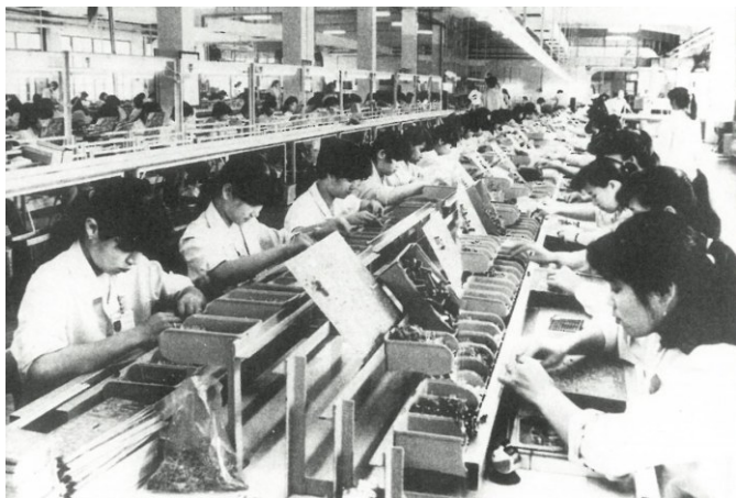
↑ 在康佳宽敞的流水线插件生产线车间里,外来女工生产出国内一流的产品。