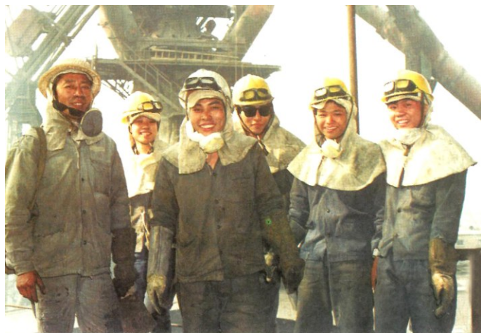
④ 胜利完成高炉大修的广州钢铁厂工人