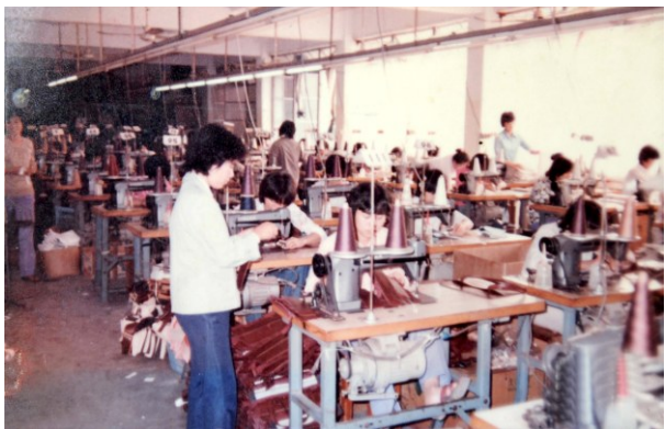
↑ 1978年8月,内地引进的首家“三来一补”企业——东莞太平手袋厂诞生,成为中国改革开放的标志性事件。《南方日报》评论:“小小手袋厂一根拉链拉开了中国改革开放的序幕。”