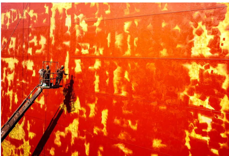
《红妆》手机组银奖

为喜迎中国共产党成立100周年,由广东省总工会指导、广东省职工文化体育协会主办的“中国梦·劳动美——我心向党”广东省职工摄影展获奖名单近期揭晓。10036幅参赛作品被分成相机组和手机组,并从各组中分别角逐出金奖各2名,银奖各4名,铜奖各15名。