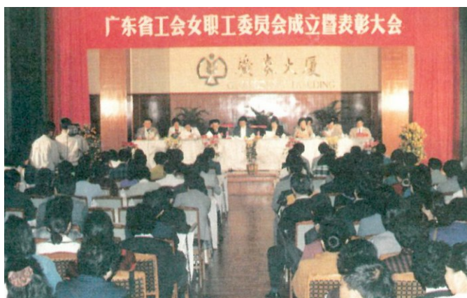
1991年3月,广东省工会女职工委员会成立。