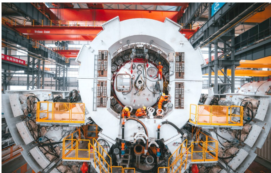
《劳动协作》相机组银奖