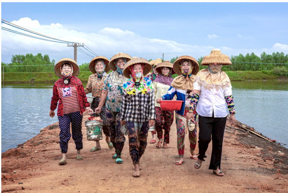
《勤劳挖螺女》相机组银奖