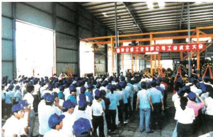
1986年1月,广州市乡镇企业第一个工会——石井水泥厂工会成立。