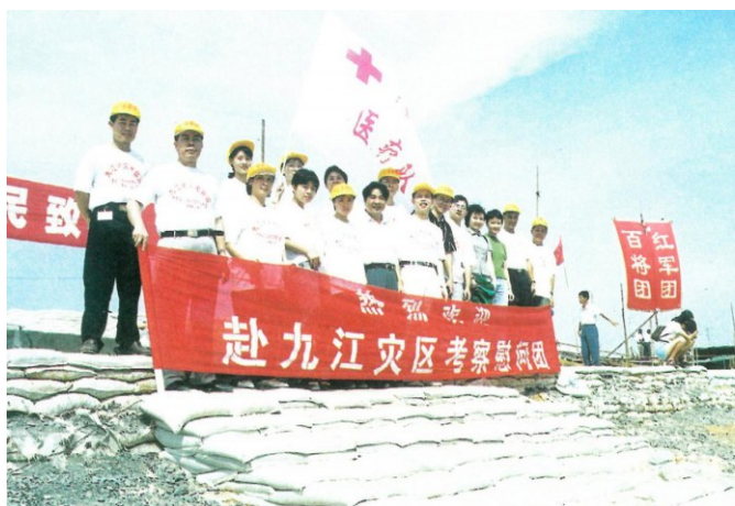
1998年9月,广东省总工会医疗队奔赴江西九江灾区送医送药。