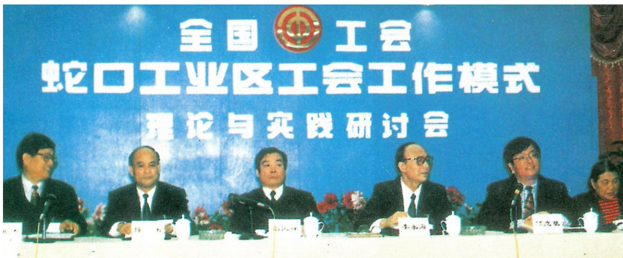
1995年2月，“蛇口模式”研讨会。

程》，天天跑三资企业抓组建工会，大半年下来，成效不佳，难度很大。有的企业只打发一名小职员来接待，企业高管避而不见；有的企业老总却说《工会章程》不是法律，企业遵守的是中国法律；更有的企业把他们挡在大门口。