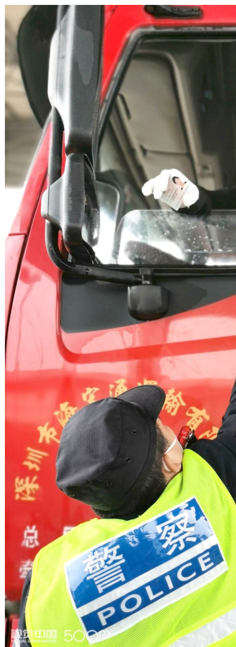
《百分百配合》手机组金奖