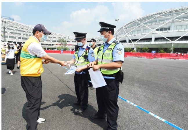
禅城区劳模抗疫服务队把中药汤剂送给一线工作的辅警。