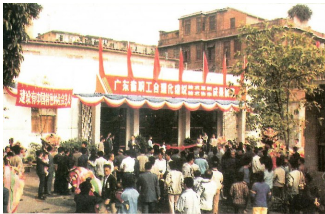
1987年,广东省职工合理化建议成果展览。