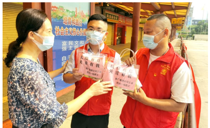
佛广集团工会慰问接受封控的职工。