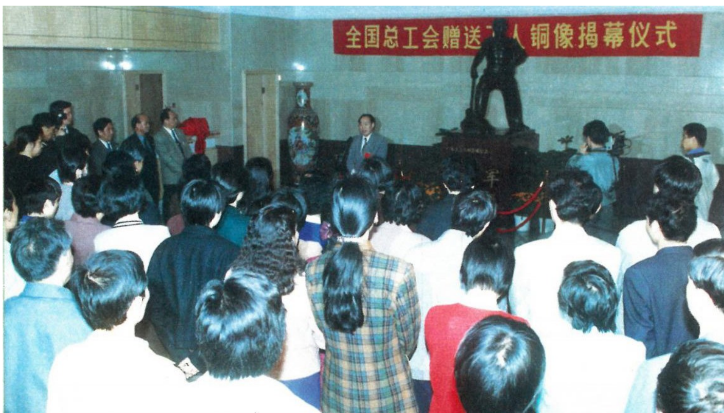
④ 全总为广东工会大厦落成赠送工人铜像揭幕式。