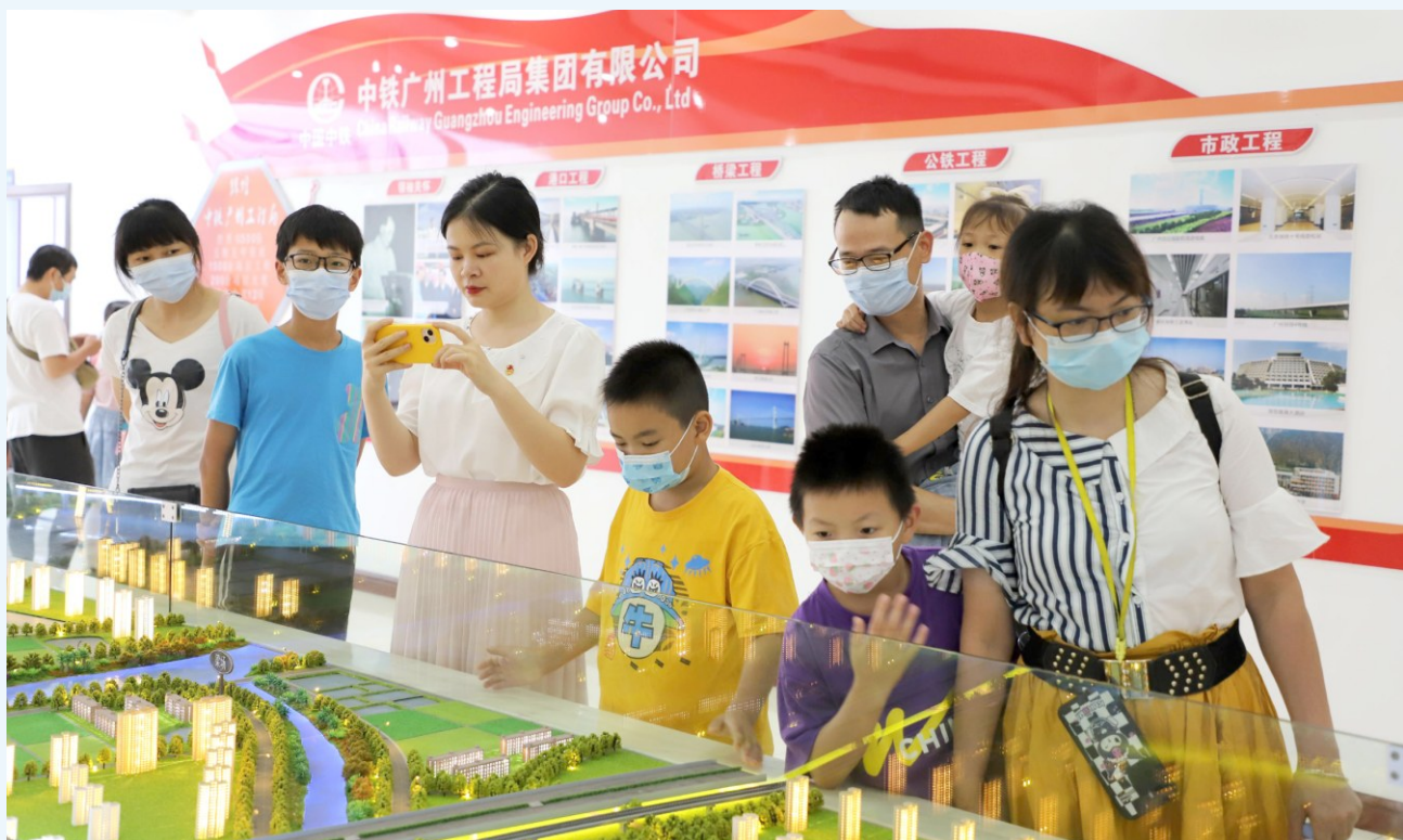
新业态劳动者家庭参观中铁广州工程局集团有限公司广湛铁路项目部

下一步,省总工会将认真学习宣传贯彻党的二十大精神,进一步加强包括互联网企业在内的新经济组织、新社会组织、新就业群体的工会组织建设,提高覆盖面;进一步深化工会“六有”规范化建设,使基层工会转起来、活起来;进一步做好互联网企业工会维权服务工作,探索具有互联网特色的工作机制和服务方式,发挥其桥梁纽带作用。