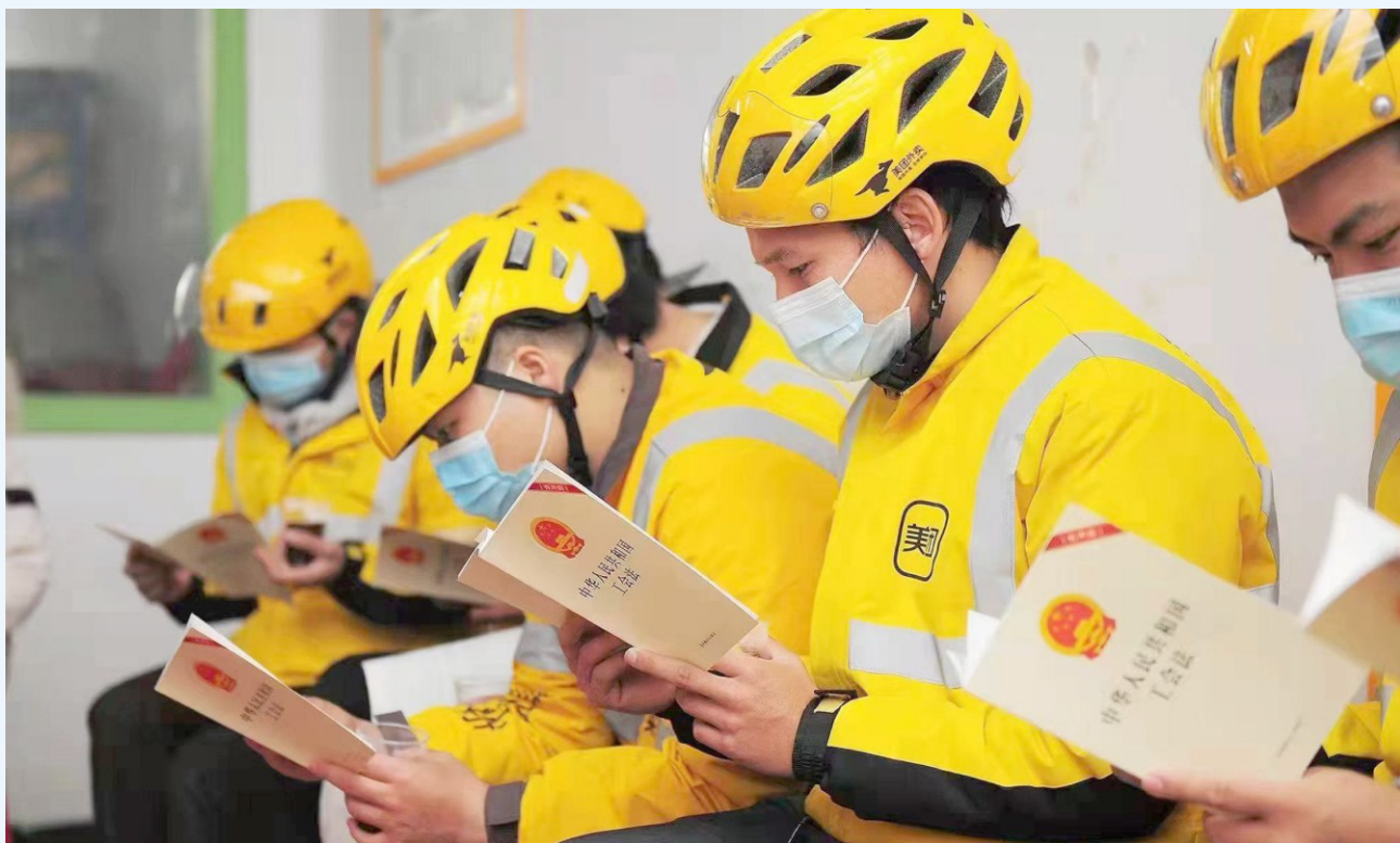
广州网约配送员学习《中华人民共和国工会法》