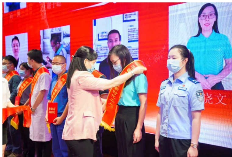
2022年9月23日，河源市总工会表彰10名“最美新时代工人”

通过“党建带工建”机制，使工会组织建设与党的基层组织建设在指导思想上一致，在工作目标上相协调，在工作部署上相呼应，在工作成效上相促进，保障工会工作的落实。把握非公企业党建摸排和组织建设“双同步”工作契机，推动同步建立党组织和工会组织。大力推进新就业形态从业人员入会集中行动，下发《河源市总工会关于进一步加快推进新就业形态劳动者建会入会工作的通知》《河源市总工会 河源市邮政管理局〈关于进一步加强全市快递行业工会组织建设的实施方案〉的通知》，最大限度把网约车司机、货车司机和快递员、网约送餐员等新就业形态人员组织到工会中来。今年以来，全市新建基层工会组织 153 家，基层工会换届 256 家，发展会员 15398 人，其中，吸收新业态行业会员发展会员 11211 人，完成省总工会任务的 184.4%，新建非公企业党组织 35 个、新发展产业工人党员 420 名。下发《关于加强工会会员实名制系统及“粤工惠·河源号”推广应用的通知》，今年 8 月至 11 月，投入资金 50 多万元，开展建会、普惠活动 6 场，受益职工 1.9 万人次。目前，我市在全省粤工惠实名制系统工会组织