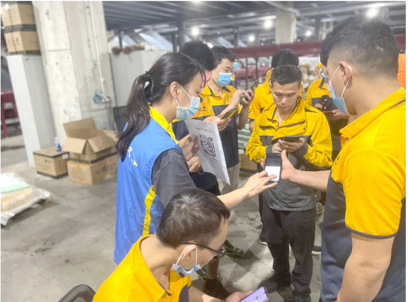
中山市小榄镇工会干部走进新就业形态劳动者当中宣讲工会政策 / 资料图