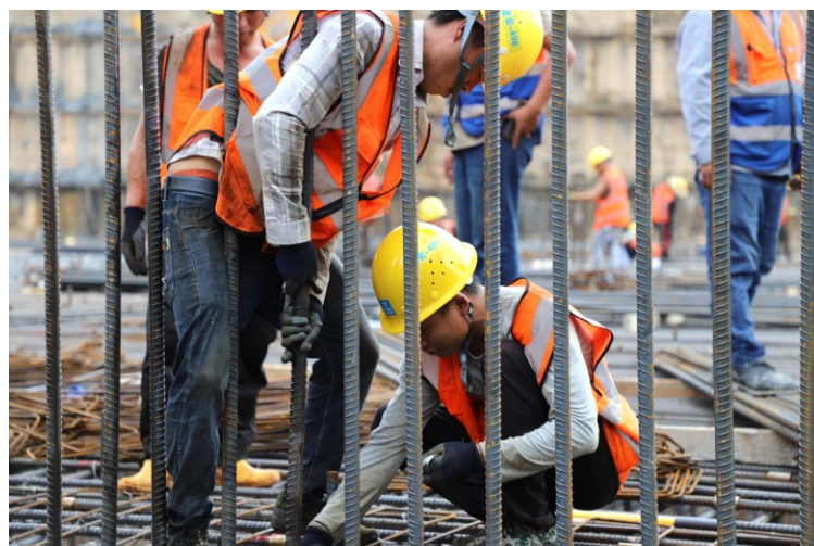
▲年底，广东不少重大工程项目都进入了建设高峰期。在粤建设单位以更科学精准的手段，克服疫情带来的影响，稳步推进各个重要施工节点，掀起大干热潮。图为施工现场，工人们在忙碌。/资料图