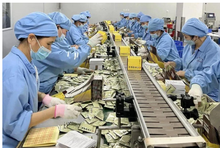
▲近期，为了满足民众的购药需求，广药集团坚持“不涨价、不停工，保证产品质量、保证公益为上”的“两不两保”承诺，旗下连锁药店全力备货，旗下药品生产企业加班加点积极扩产，全力以赴保障市场供应。图为白云山小柴胡颗粒生产线马力全开，每日满负荷生产。