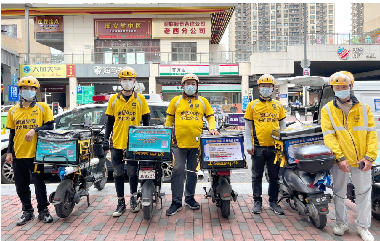
外卖员的送餐车后张贴有疫情防控宣传海报 / 资料图