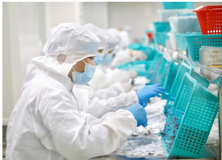
▲自12月7日疫情防控“新十条”实施以来，广东各大生产企业已开足马力扩能扩产保供应。图为深圳市亚辉龙生物科技有限公司，生产车间的工人们正在加班加点生产。