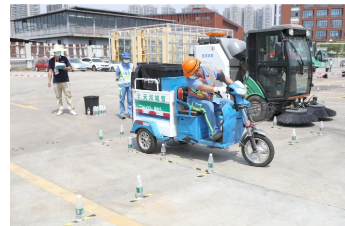
9月24日,由广州市天河区总工会、天河区城市管理和综合执法局联合举办的第六届“工匠杯”环卫技能竞赛活动在天河区吉沥路等赛场进行。本届“工匠杯”竞赛设置有垃圾分类与疫情防控知识竞赛、人机结合技能竞赛(小型扫路机+快速保洁车)、小型水车冲洗技能竞赛、疫情专项垃圾收集技能竞赛、创新技能竞赛、公厕消毒技能竞赛共六项。图为环卫工驾驶环卫车比赛倒车入库。