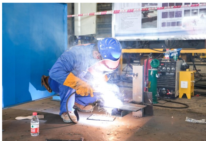
9月22日,由中建四局工会委员会主办、中建四局安装公司承办的中建四局第七届建筑工匠技能大赛、中建四局安装公司第五届“安装杯”技能大赛在东莞市企石镇精彩打响。来自中建四局各公司历经层层选拔的优秀焊工集结安装公司,一同竞技能、开展了一场“焊技四射”的电焊实操比拼。图为竞赛现场。