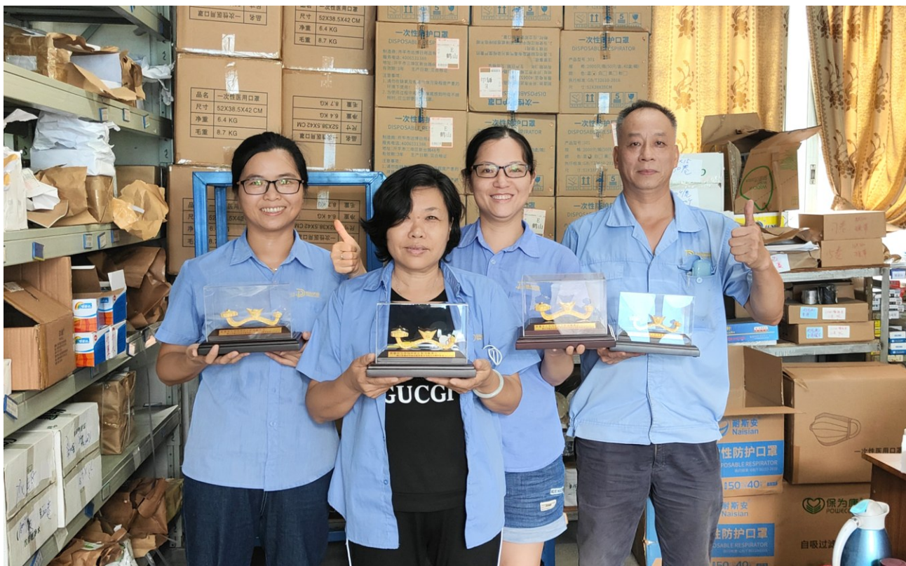
德兴环球公司为工龄满15年以上的120多名员工颁发冰箱等奖品