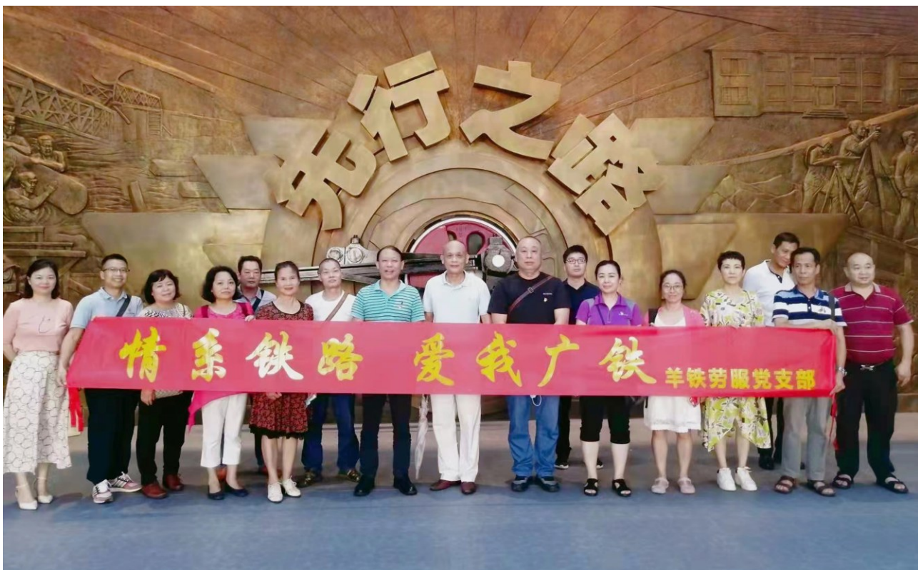
羊铁劳服党支部参观铁路博物馆