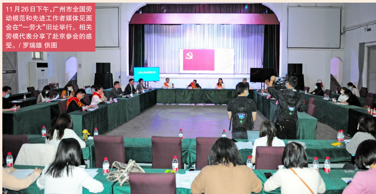
11月26日下午,广州市全国劳动模范和先进工作者媒体见面会在“一劳大”旧址举行。相关劳模代表分享了赴京参会的感受。

四、深刻理解总书记对广大劳动者的深切关怀,做好维权服务和维护职工队伍稳定工作。坚定构建新型和谐稳定劳动关系,完善政府、工会、企业共同参与的协商协调机制,深化工会+法院、工会+仲裁创新,健全法律援助、法律监督、集体协商、民主管理“四位一体”维权机制;坚定发展社会化职工服务格局,以回归主业、服务职工为主旨深化工会事业单位改革,推动建立覆盖全社会的、包括农民工在内的公共文化服务体系,完成好城市困难职工解困脱困工作等重要工作;坚定深化工会改革创新,落实“粤工惠”APP工作部署,推进“智慧工会”建设,发挥工会的组织优势、力量优势、资源优势,在推动形成“联系广泛、服务群众的群团工作体系”中发挥省会城市带头作用。