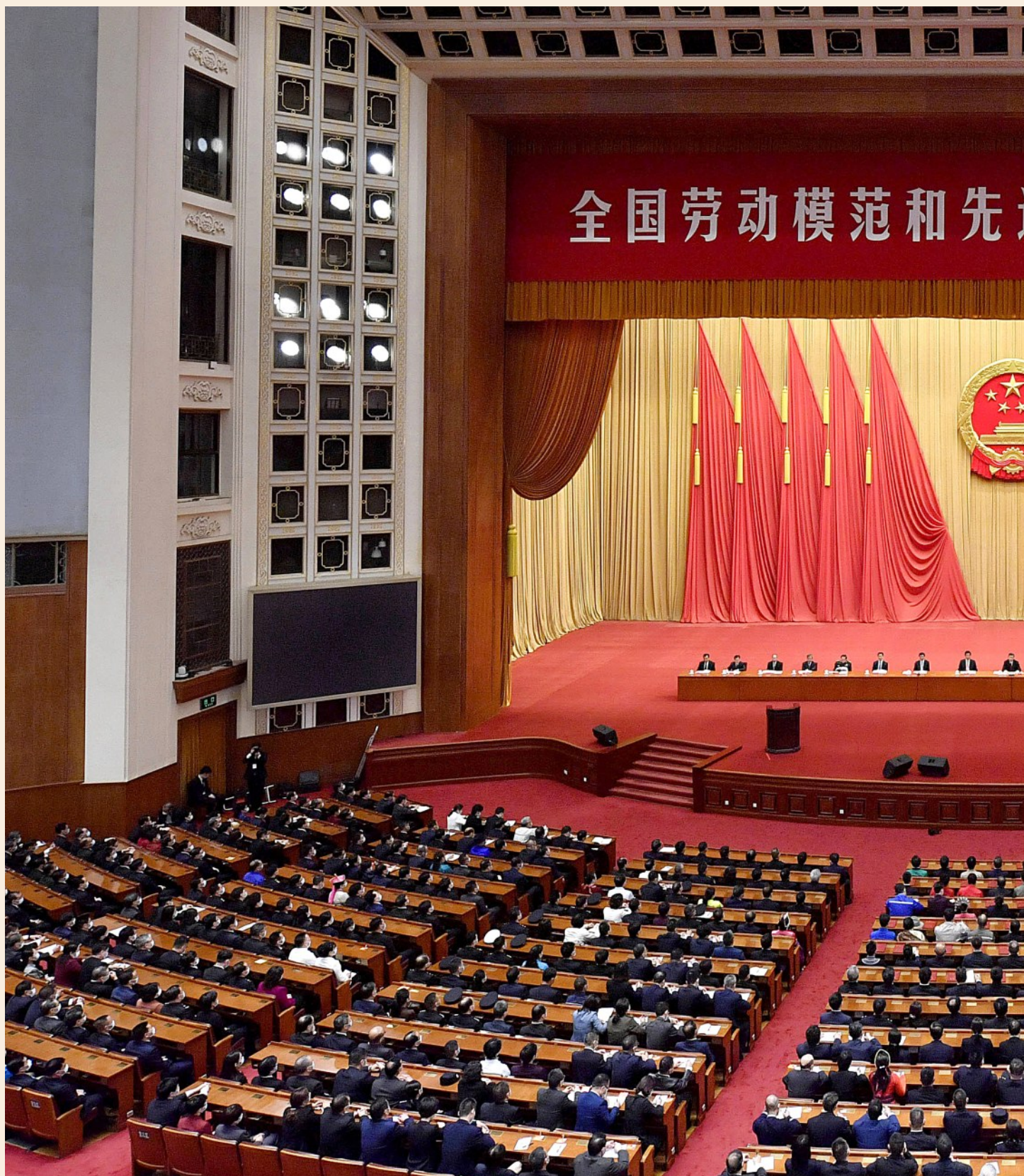
↑ 全国劳动模范和先进工作者表彰大会 11 月 24 日上午在北京人民大会堂隆重举行。