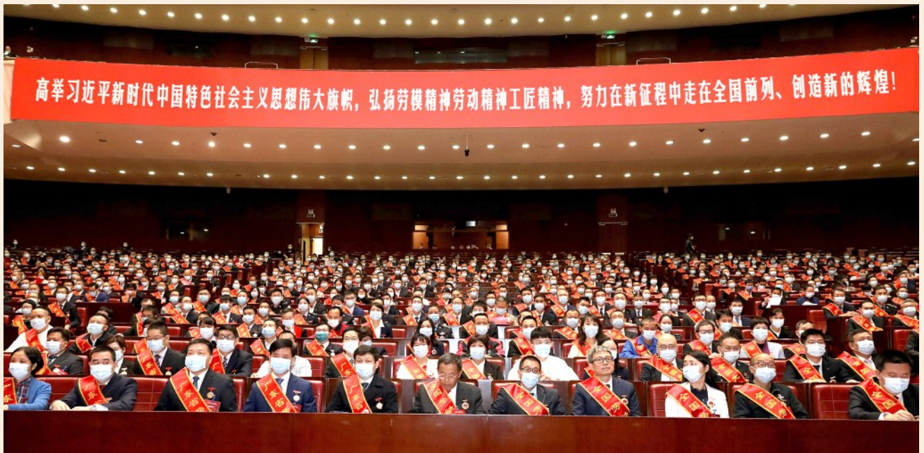
12月2日,2020年广东省劳动模范先进工作者和先进集体表彰大会在广州召开。