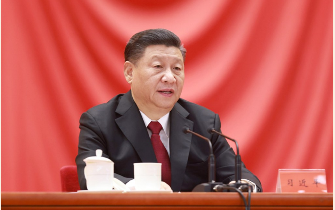
中共中央总书记、国家主席、中央军委主席习近平出席全国劳动模范和先进工作者表彰大会并发表重要讲话。