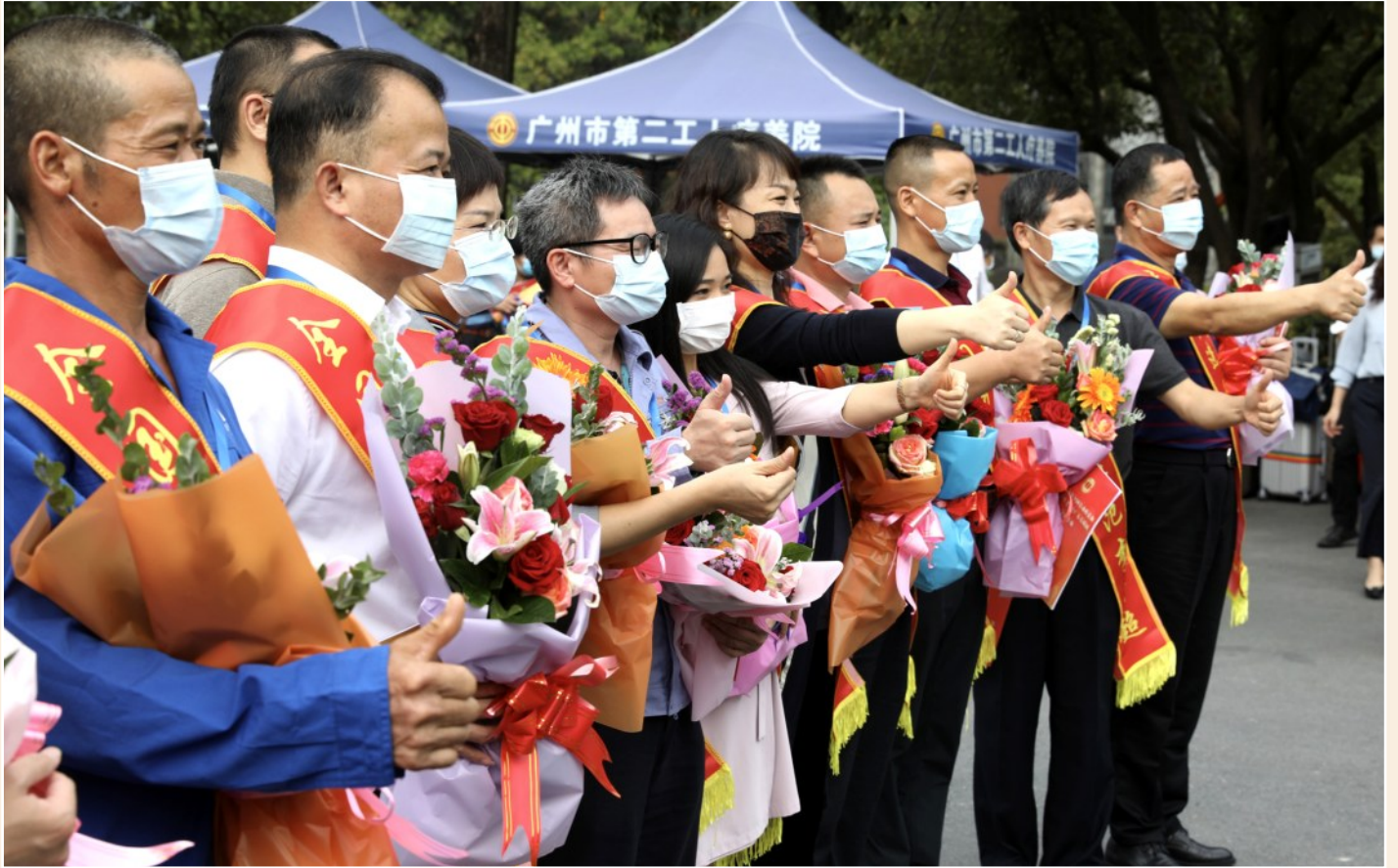
↑ 1月22日,广东省总工会在广州白云国际机场欢送我省全国劳动模范和先进工作者赴京受奖。图为劳模们在为劳模精神点赞。