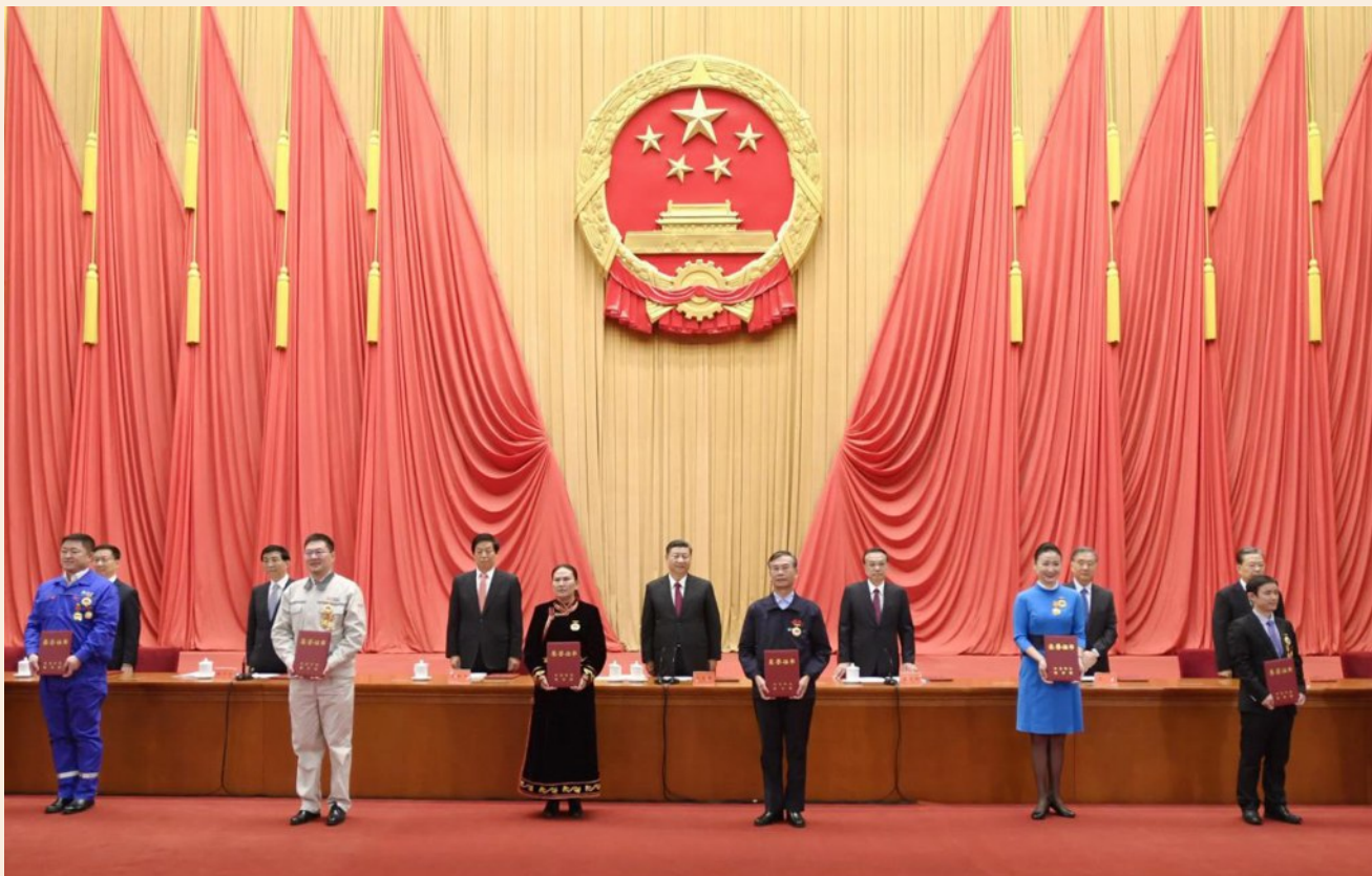
习近平等党和国家领导人向全国劳动模范和先进工作者代表颁发荣誉证书