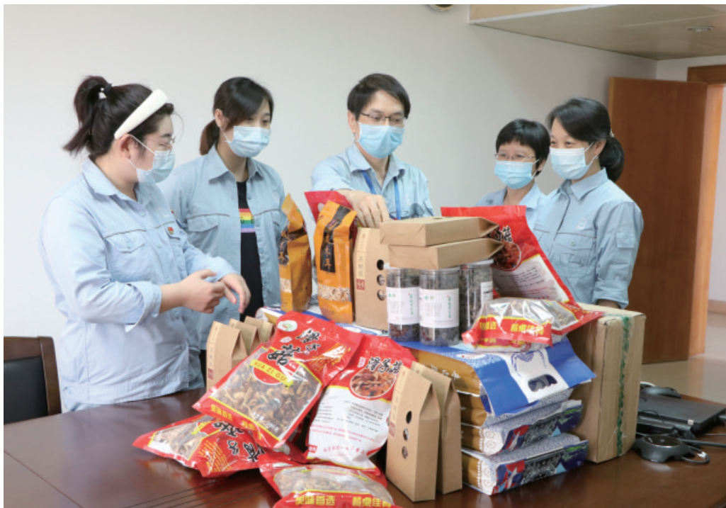
4月17日起,茂名石化工会开展消费扶贫行动,帮助贫困地区解决农副产品滞销难题。图为公司工会采购的扶贫产品到货了。

五是积极做好员工心理疏导。身处一线员工,既要抗击疫情,又要全力保持正常生产,工作负荷重、心理压力大。公司工会坚持“三知四访五必谈”(知员工家庭地址、家庭状况、技术状况,对工伤或患病、生活有困难、家中有丧事、家庭有纠纷的员工要登门家访,员工情绪低落、违章违纪受批评、工作岗位有变动、同志邻里闹矛盾、取得荣誉必谈),开展员工心理疏导、情绪支持等服务。关注居家隔离人员的思想情绪和心理健康,第一时间释疑解惑,稳定情绪,增强