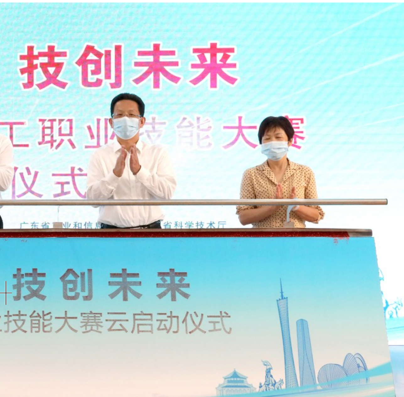
与会领导共同启动 大赛