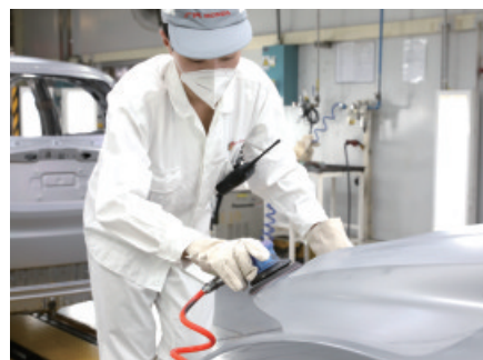
用打磨机打磨搓痕