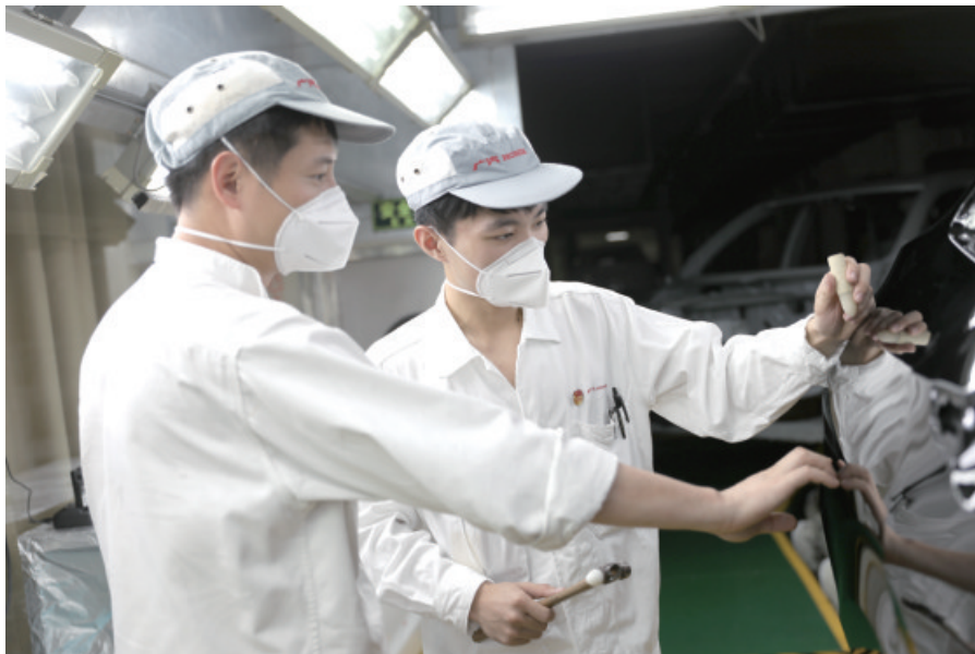
与同事交流工作经验