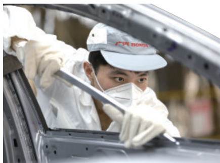
用钣金撬修复面板凹凸