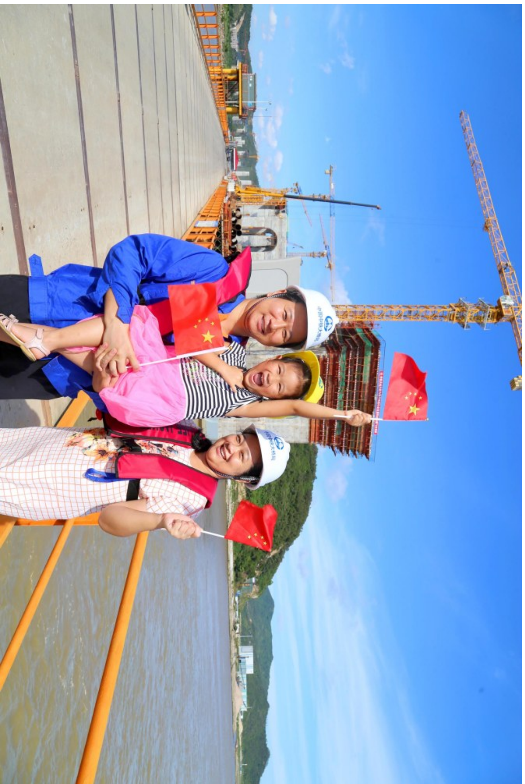
“小候鸟”来“探班”