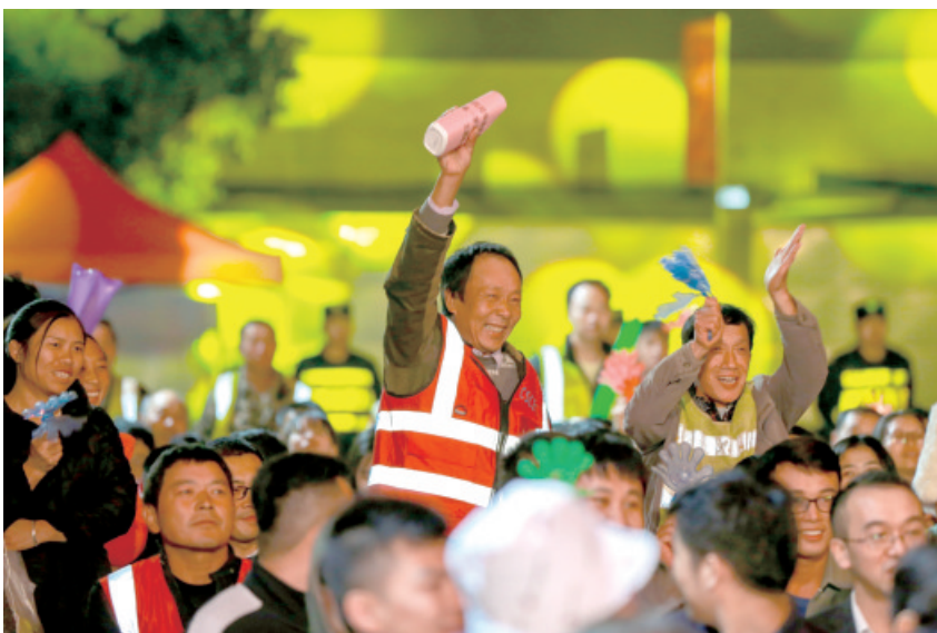
2019年12月27日晚,中建四局华南建设有限公司在广州黄埔区保盈商业广场项目举行主题晚会,为近400名工友带来一场精彩演出。

当前,媒体格局和舆论生态发生深刻变化。互联网日益成为人们特别是年轻一代获取信息的主要途径,网络舆情直接影响着人们的思想观念和价值取向。习近平总书记在《习近平谈治国理政》第三卷中指出,“网络是一把双刃剑,一张图、一段视频经由全媒体几个小时就能形成爆发式传播,对舆论场造成很大影响。这种影响力,用好了造福国家和人民,用不好就可能带来难以预见的危害。”因此,我们必须在继承发扬成功经验和优良传统的基础上推进工会意识形态工作的理念创新、手段创新、措施创新。顺应社会发展进步新趋势,适应现代传播新格局,扎实推进“互联网+工会”工作,强化网上工会建设。健全完善网络舆情处置应对机制,加强网上舆论引导,开展网上舆论斗争,掌握网络舆论工作的主动权。树立大宣传和全媒体理念,用先进的理念、手段、技术传播先进的思想文化。