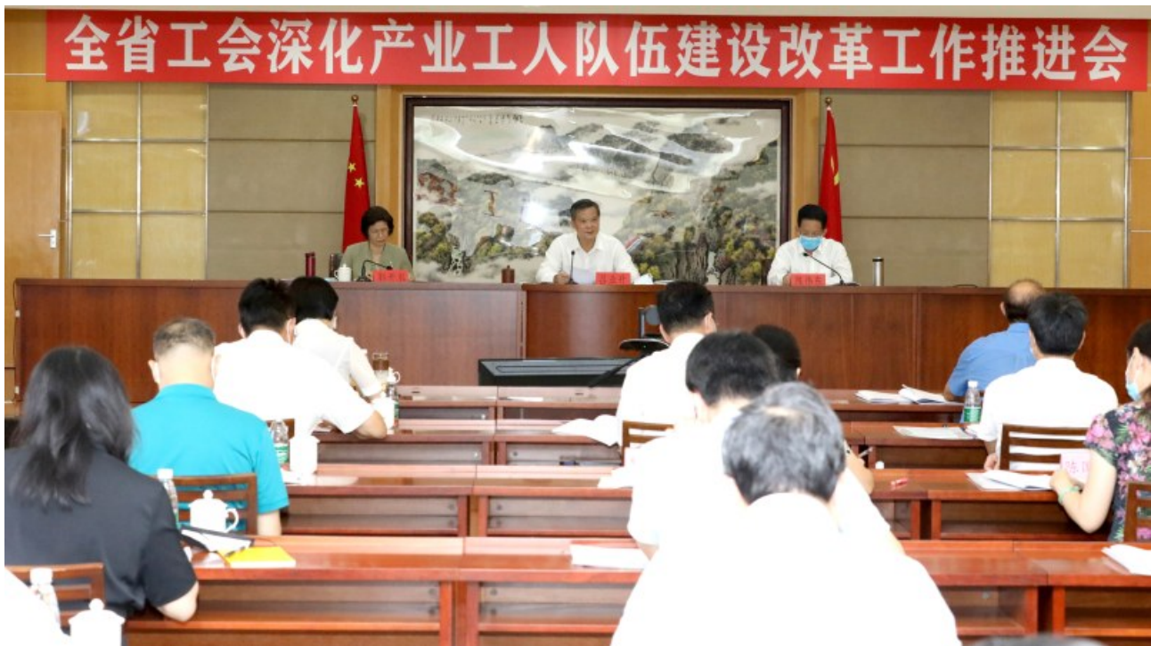
会议现场

任务,围绕“政治上保证、制度上落实、素质上提高、权益上维护”,进一步提高产业工人素质,广泛深入持久开展“当好主人翁、建功新时代”主题劳动和技能竞赛,抓好“五小”等群众性经济技术创新工作品牌建设,加大产业工人大培训、求学圆梦行动等工作力度,针对性实施新生劳动力技能提升、农民工技能提升、技师继续培训、技能精英培养等行动,深化工匠学院建设、劳模和工匠人才创新工作室创建,为产业工人素质提升创造更好条件,建立与我省产业发展需要相适应的产业工人技能形成体系。进一步畅通产业工人发展通道,健全保证产业工人主人翁地位的制度安排,推动打破职业技能等级与专业技术职务之间界限,打破产业工