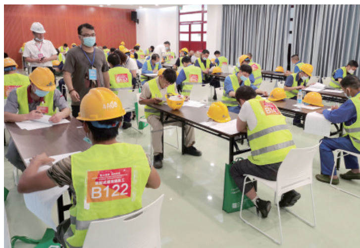
佛山建设分会场, 装配式建筑职业技能竞赛现场