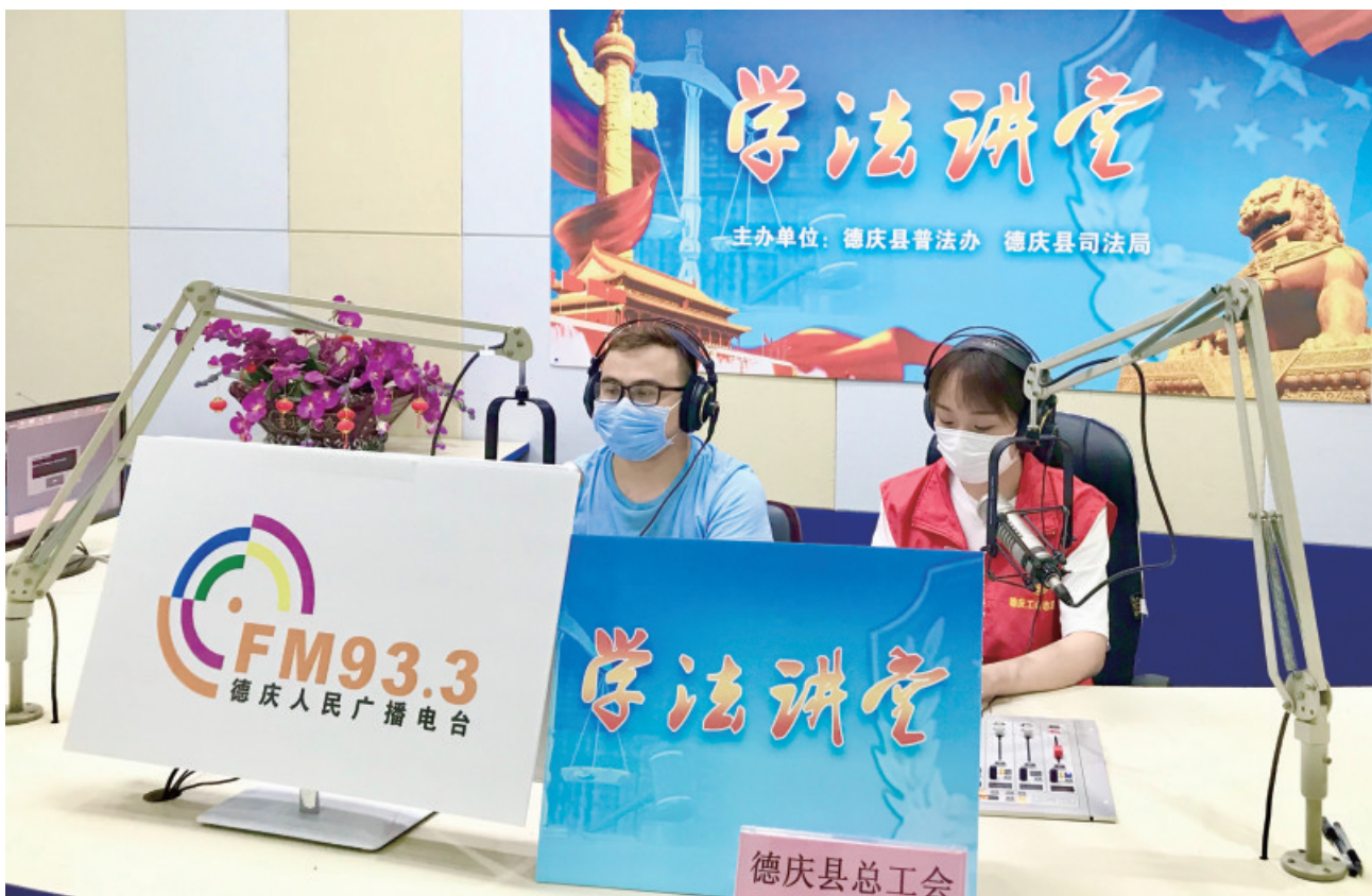
5月6日,肇庆德庆县总工会作客德庆电台《学法讲堂》节目,开展普法宣传。