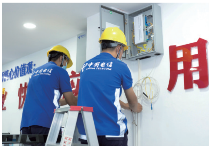
中山电信分会场, 智慧家庭工程师技能竞赛现场