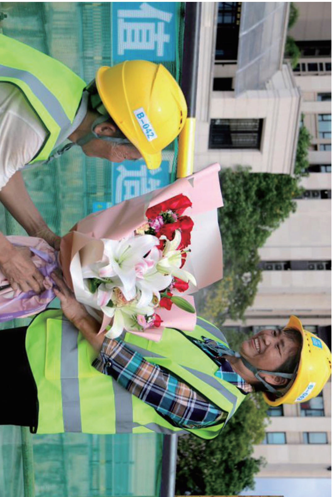
工地上的“520”告白