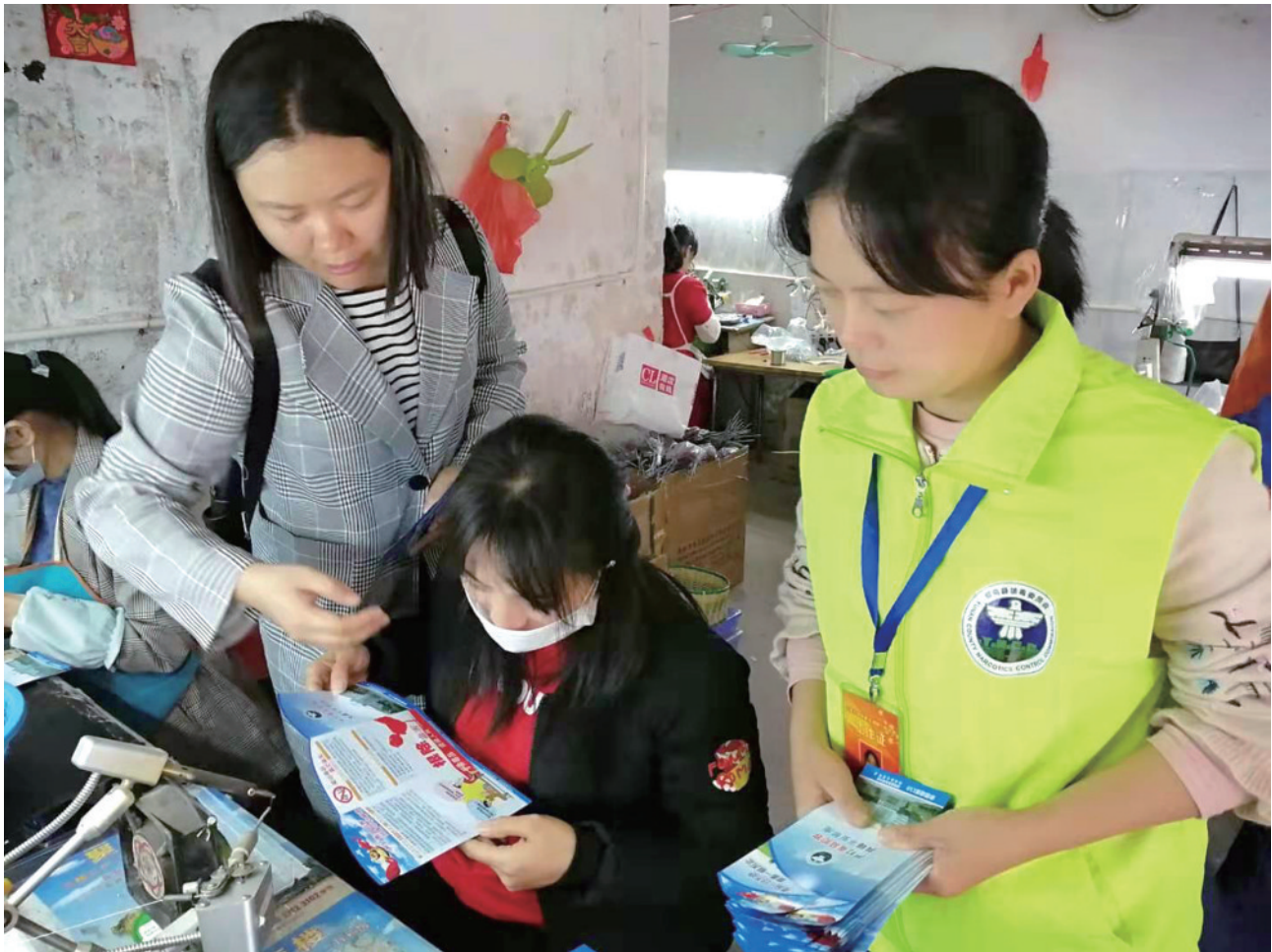
2019年12月17日,郁南县总工会、连滩镇禁毒办联合开展禁毒宣传进工厂活动。/资料图片