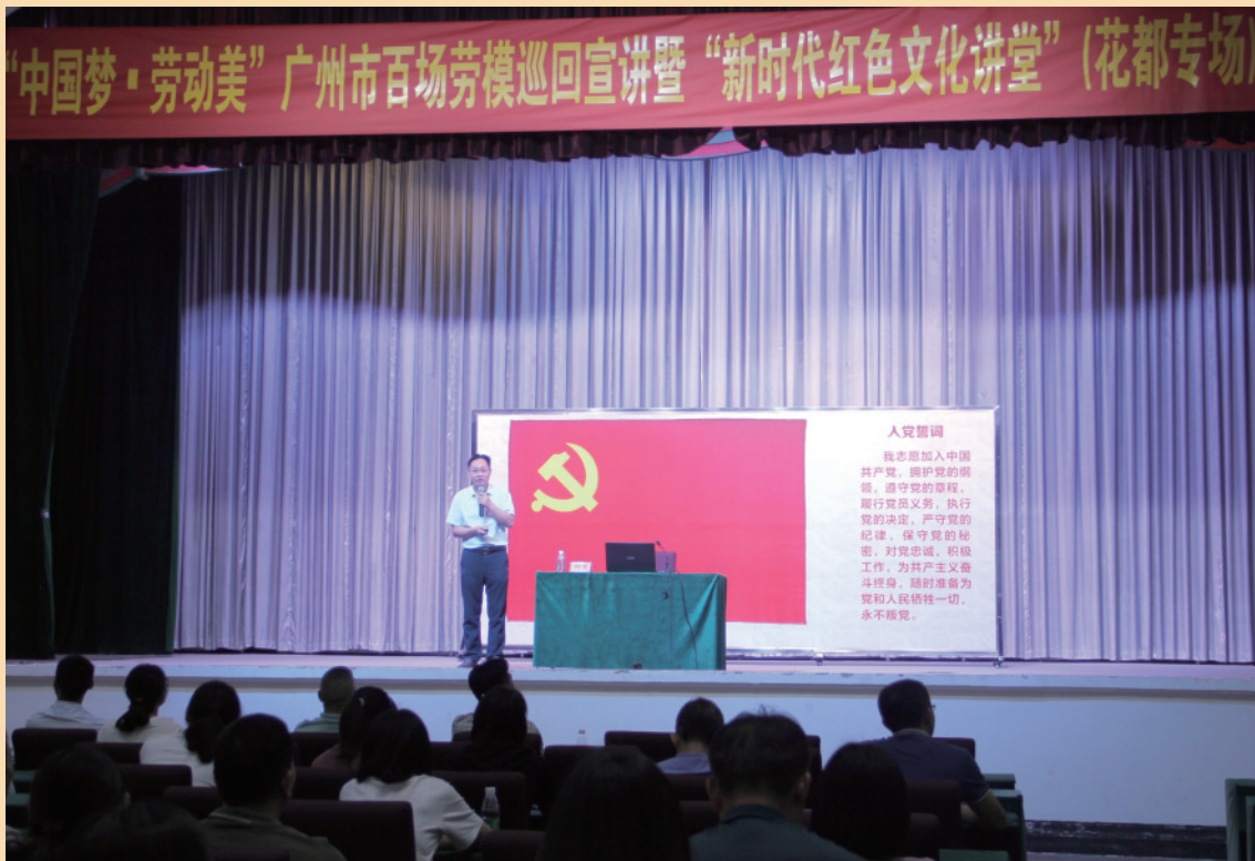
广州市百场劳模暨“新时代红色文化讲堂”宣讲活动举行。

和发展革命根据地社会经济建设中发挥了巨大的示范和带头作用,为革命取得最后胜利奠定了扎实的社会基础。社会主义建设时期,劳动模范以无私奉献、团结苦干的精神积极投身于经济建设中,为引导广大人民群众集中精力恢复和发展国民经济,树立正确的社会主义劳动观念起到重要的推动作用。改革开放以来,广大劳动群众不仅发扬吃苦耐劳、艰苦奋斗的高尚品格,更是在开拓创新、苦干实干中创造了中国奇迹,业务精湛、技术卓越、锐意进取、敢为人先的劳模形象更加深入人心。进入新时代,在中国共产党的领导下,中国人民以实干兴邦的劳动精神,继续谱写中国特色社会主义伟大事业的新篇章,劳