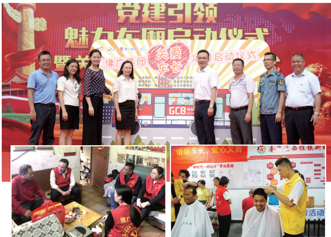
佛广集团关爱公交司机系列活动

APP、“家佛广V”、“佛广交通集团”微信公众号及微博;“5软件”即直联制、“面对面、心连心”座谈会、职工家访、“书记走基层”大讨论活动、“两代表一委员工作室”。如“司机一点通”APP,车长通过手机“一点就知”工资、油耗相关信息,真正把企业服务与职工需求缩短为“指尖上的距离”。“家佛广V”微信公众号每日推送车长关心关切的信息,线上线下一起联动。“面对面、心连心”座谈会自2012年开展以来,至今已召开了900余场次,车长畅所欲言,收集意见和建议2500余条,基本得到了解决。“7+5”软硬件就像职工的“大管家”,及时掌握职工的基本信息,解决职工诉求,提供精细化服务。