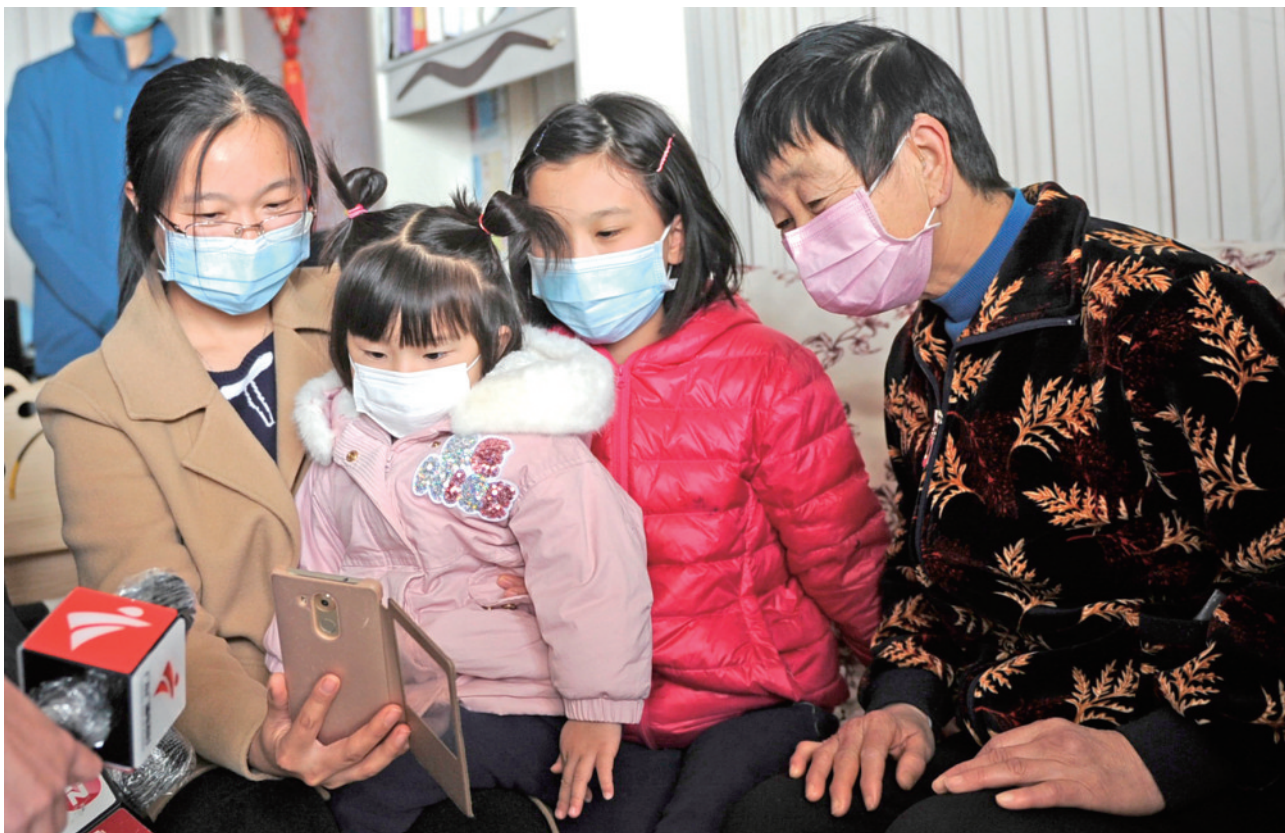
2月,广州市总工会联合团市委、市妇联慰问援鄂医疗队成员的家属,给他们送上防疫物资和新鲜肉菜。