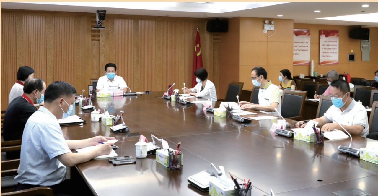
5月2日,省总召开党组扩大会议。

5月2日上午,省总工会召开党组扩大会议,专题传达学习习近平总书记给郑州圆方集团全体职工重要回信精神,对全省各级工会学习贯彻工作进行安排部署。省总工会党组书记、常务副主席陈伟东主持会议并讲话。