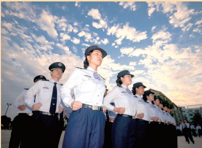
保持干劲,在平凡岗位上续写不平凡的故事! / 资料图片