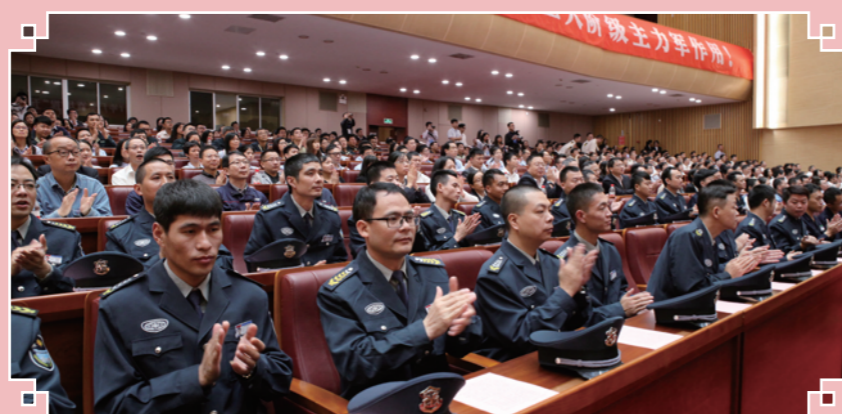
广东省庆祝“五一”国际劳动节暨劳模表彰大会现场（选登）