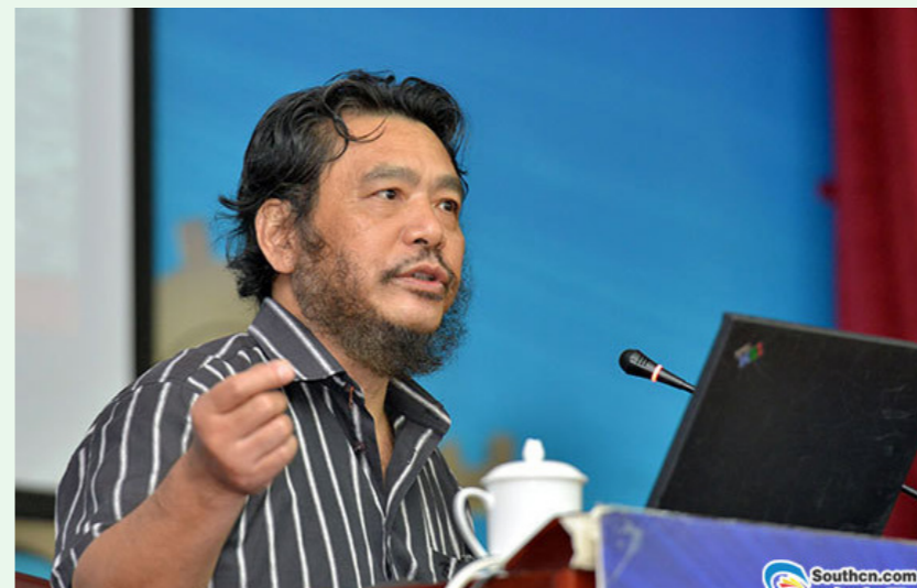
■ 第 26 期广东职工大讲堂主讲嘉宾黎明在台上演讲

“独立寒秋，湘江北去，橘子洲头。……曾记否，到中流击水，浪遏飞舟？”在互动环节，黎明饱含深情，以地道的长沙方言朗诵《沁园春·长沙》，引来职工代表阵阵掌声。