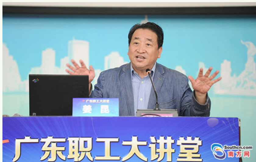
■第 27 期广东职工大讲堂主讲嘉宾姜昆在台上演讲

姜昆此番来粤的初衷是将这门艺术更好地向大众普及。他日前意外遭遇右脚骨裂，还未完全恢复，出行要拄拐杖。整场演讲持续近两小时，听众享受了一场曲艺文化大餐，不时爆出热烈掌声与笑声。