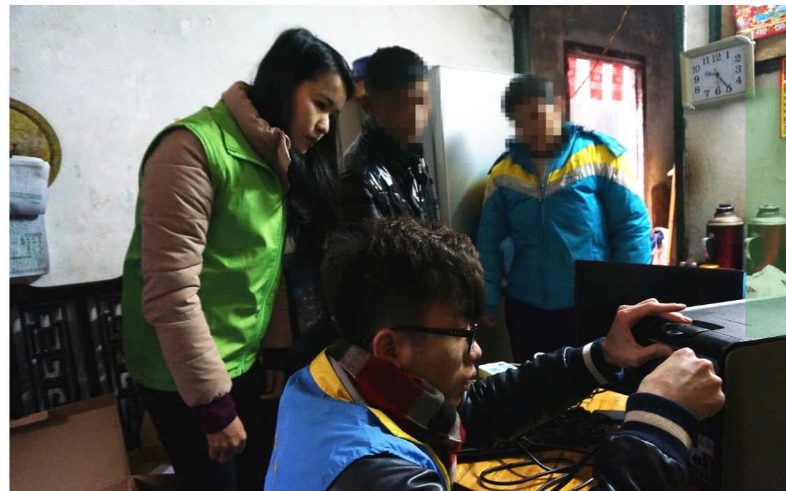
←工会义工帮忙安装电脑

据悉，在7月至8月期间，市工会义工队在全市广泛开展“共筑七彩梦”系列关爱活动。一方面组织就读大学阶段困难职工子女开展职前培训讲座，提高他们在未来职场的竞争能力。另一方面南朗镇、沙溪镇、三乡镇等镇区工会义工分队结合实际开设“七彩课堂”，通过多种途径和形式，为异地务工人员及其随迁子女讲授亲子关系的相关课程，并为随迁子女举办“小候鸟”暑期系列活动，解决职工的后顾之忧。（文\陈静 罗俊斌）