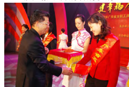
广东省人大常委会副主任、省总工会主席邓维龙为获奖人员颁奖