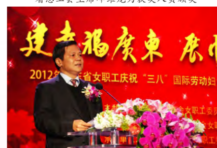
省总党组书记、副主席郭泽宇在颁奖大会上致辞