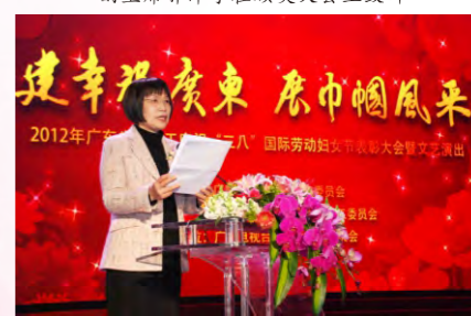
广东省总工会副主席、女职委主任王丽华宣读表彰决定