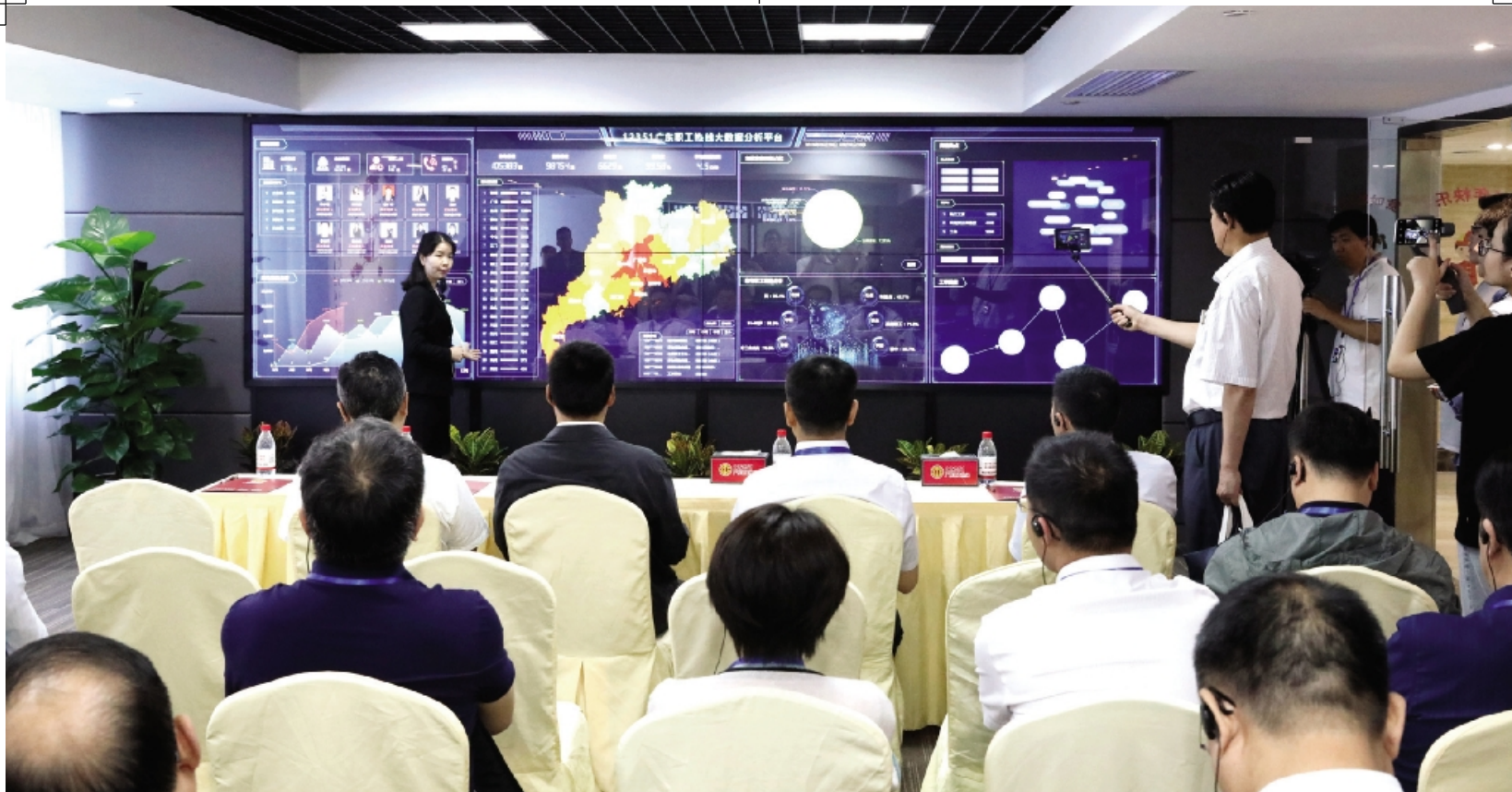
全国工会信访工作者一行参观 12351 广东职工热线中心,了解广东工会信访工作开展情况。