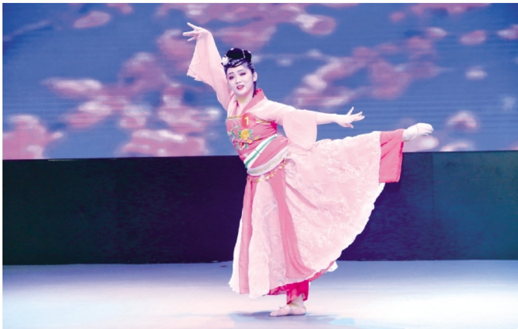
3月20日,深圳龙岗区龙城街道总工会举办了“职工之星”龙城街道选拔赛。图为参赛选手的舞蹈表演。

承劳模精神,激发全区干部职工工作热情;珍惜荣誉,努力为龙岗改革发展作出新的更大贡献;并号召全区广大干部职工要进一步传承和弘扬工匠精神,以昂扬的精神、饱满的热情,发挥聪明才智,挥洒青春汗水,为龙岗经济社会发展添砖加瓦。