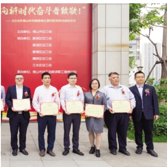
5月9日,“向新时代奋斗者致敬——2019年佛山市劳模精神主题月系列活动”在佛山新城职工服务中心启动。劳模工匠精神讲师团的14名讲师代表现场获颁证书。讲师团接下来将走进企业、园区、学校、医院、社区开展巡回宣讲。