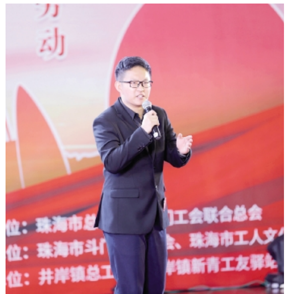
5月19日,由珠海市总工会和澳门工会联合总会举办,斗门区总工会珠海市工人文化宫承办的“礼赞新时代·追梦我当先”珠澳职工文化节演讲比赛在新青工友驿站圆满落幕。来自全市行政机关、企事业单位的32名选手参赛。