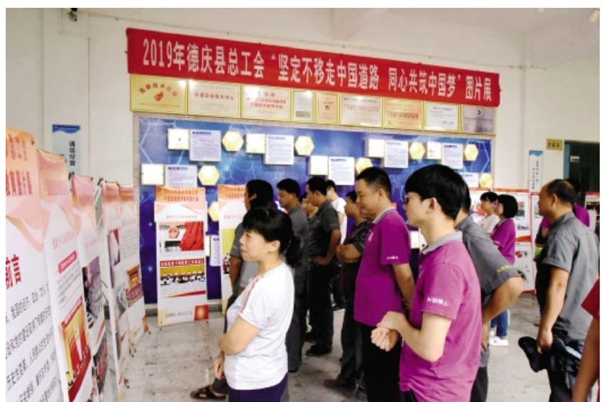
5月上旬,肇庆市德庆县总工会走进企业和学校举办“坚定不移走中国道路,同心共筑中国梦”党史、国史、社会主义发展史图片展,吸引了1500余名职工群众观看。