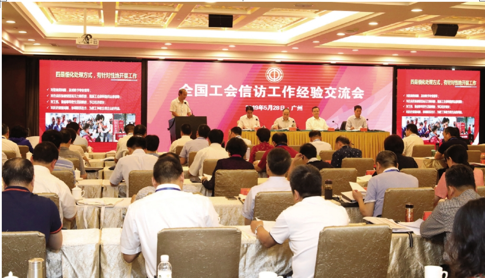
全国工会信访工作经验交流会现场