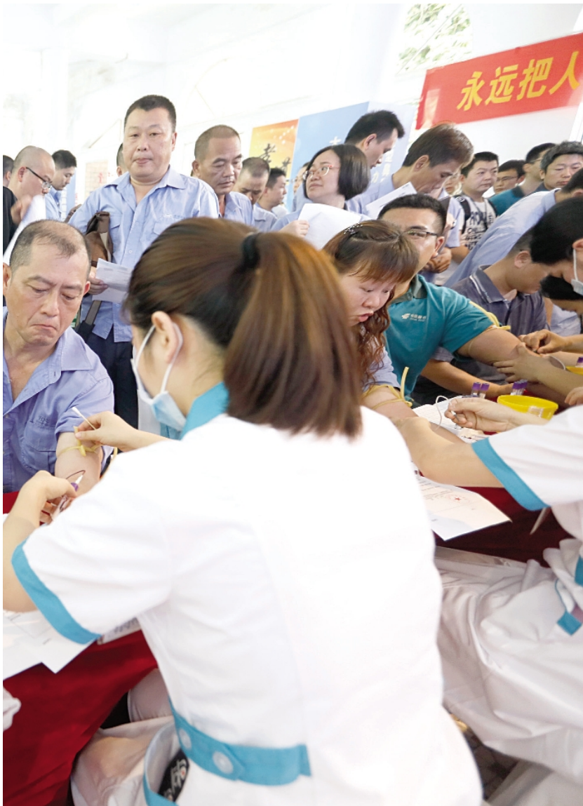
5月17日,2019年第一届“助力快递哥 健康万里行”大型鼻咽癌筛查公益活动在省工人医院举行。活动由省总工会指导,广州市总工会、广东省工人医院、深圳一道医学检验实验室主办,中山大学肿瘤防治中心、深圳市万众基因转化医学研究院支持。图为医务人员在给快递小哥采血检测。