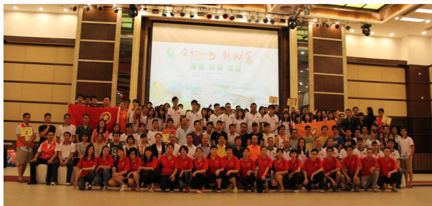
■ “奔跑吧”新财富青年联谊活动

建园初期，江门市总工会、新会区总工会、崖门镇政府及崖门镇总工会十分重视园区工会组织建设，从人力、物力、财力等方面给予全面支持。先后成立了江门市崖门新财富环保工业有限公司工会委员会和崖门环保电镀基地工会联合会，明确了领导主体，同时得到了江门市崖门新财富环保工业有限公司党支部、新财富商会等的支持，各级领导从文体活动工作年度计划的定制到活动组织的实施，项目的设置及奖品经费的落实都非常关心，亲力亲为。形成了党政领导支持，工会组织实施，各方配合的工作格局。