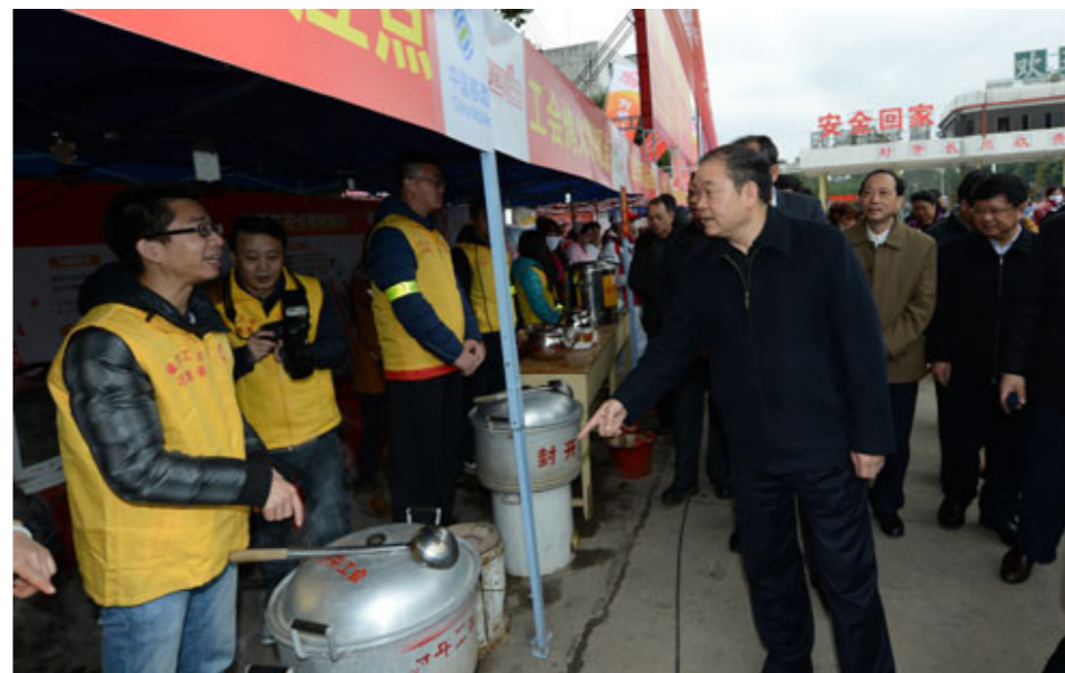
黄业斌慰问一线工作人员

2月2日，省人大常委会副主任、省总工会主席黄业斌到肇庆检查“暖流行动”情况，并与广西壮族自治区人大常委会副主任、总工会主席王跃飞一同出席了在肇庆市封开县举行的粤桂工会推进农民工维权服务机制建设工作座谈会。