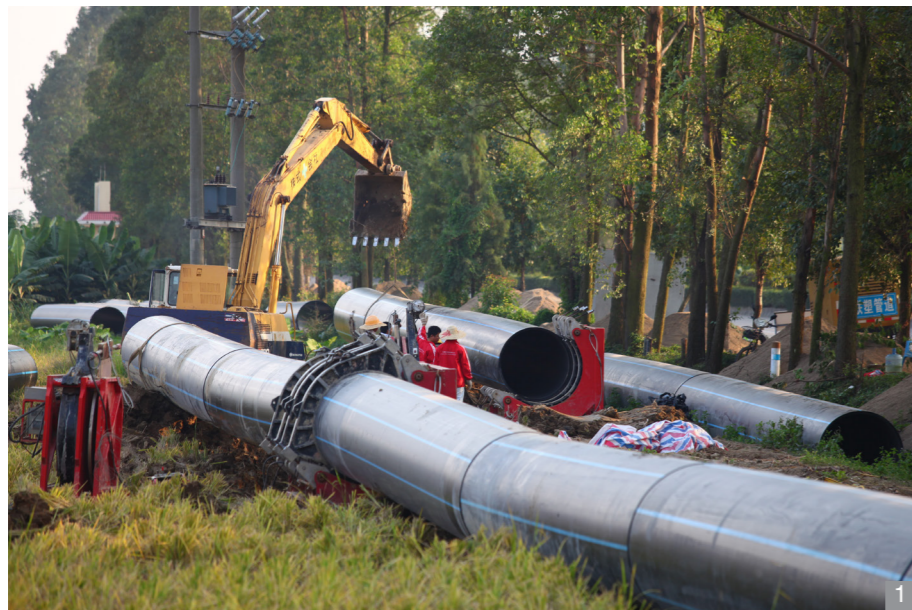
-1- 《造福桑梓》 ——新会城区优质供水工程》 光圈 4.0, 快门 1/320 秒