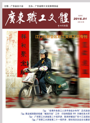
封面摄影：《送福音》雷顺意