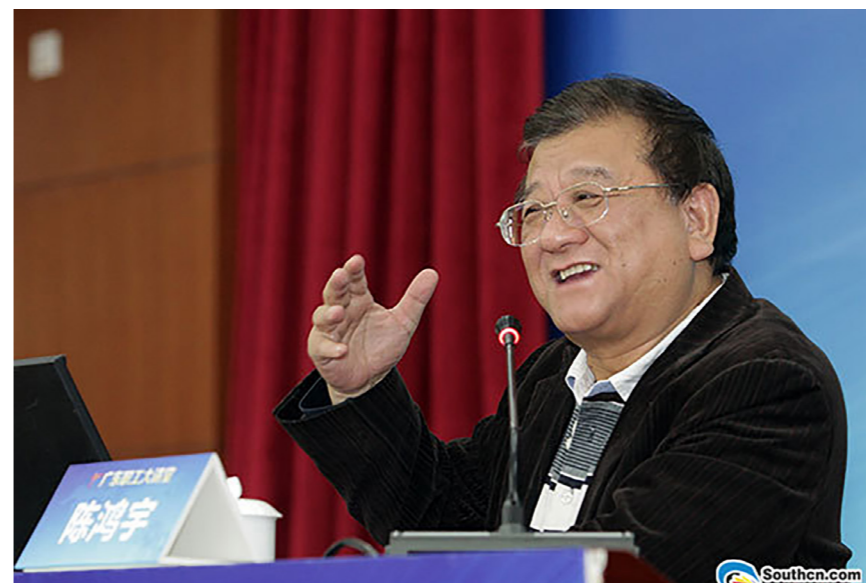
■陈鸿宇为职工解读“十三五”规划建议

“再过一个月，我们就要迈入‘十三五’，新理念下的新蓝图，我们的生活将迎来什么新的变化呢？”11月30日上午，广东省政府参事、省委党校教授陈鸿宇做客第20期广东职工大讲堂，以生动形象的例子详细解读了《中共中央关于制定国民经济和社会发展第十三个五年规划的建议》（以下简称《建议》）这一发展新蓝图，与广东职工一起分享和展望了和大家生活息息相关的身边的“十三五”。