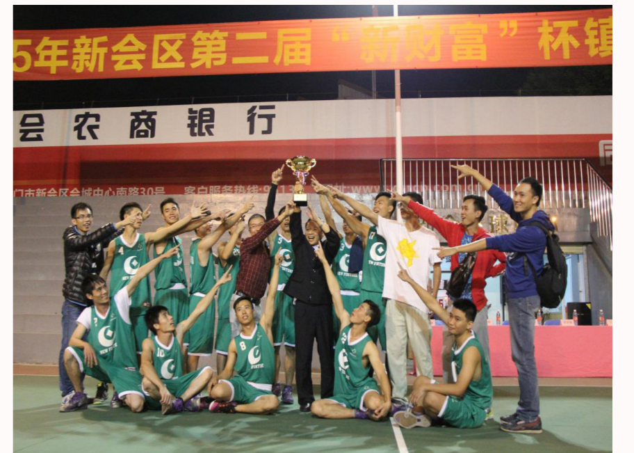
■ 新会区“新财富杯”镇级篮球邀请赛

动大家的积极性，在推动企业和谐健康发展中有着很强的凝聚力和战斗力。工会定期召开委员会议，广泛听取一线员工的意见。结合园区实际，组织举办多场主题明确，新颖别致的活动。如每年12月31日晚的迎新倒数晚会，由歌唱比赛、幸运抽奖及知识问答等环节让职工欢度新年的到来。又如园区企业拔河赛，结合安全宣传月活动同时展开，使企业职工在体现团队协作，共同拼搏的同时，又能学到安全生产知识，得到了企业老板们的大力支持。