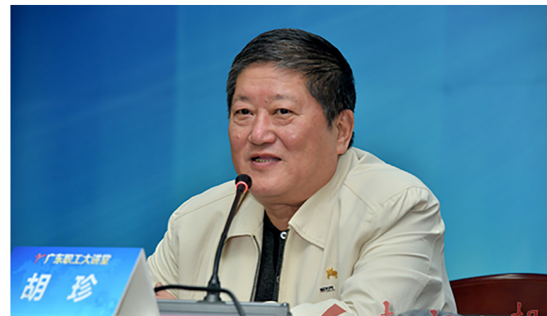
■胡珍谈企业文化建设

“企业文化就是企业的软实力，一个成功的企业，一定要有非常先进和优秀的企业文化作为引导，而工会在增强企业软实力、建设企业文化中大有可为。”12月24日上午，全国政协委员、中国文联原副主席、文化部办公厅原主任、中国艺术档案学会会长、著名书法家胡珍做客广东职工大讲堂，主讲“浅谈企业文化建设——学习习总书记关于文化工作论述的体会”。