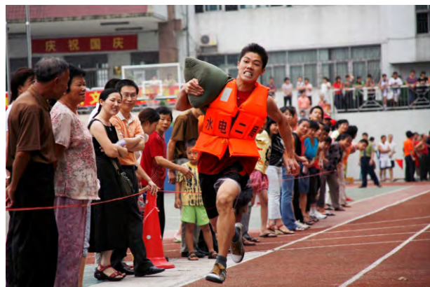
体育运动会比赛项目之一——背沙包比赛