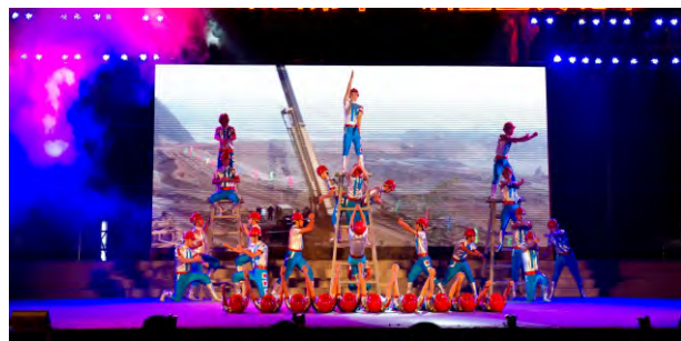
第十一届企业文化节文艺晚会比赛

公司作为省防汛机动抢险分队，多次参与北江、西江等重要部位的防洪抢险，做到“召之即来、来之能战、战之能胜”，被授予“广东省抗洪救灾先进集体”。在抗击冰雪灾害斗争中，公司妥善安排好本单位外来工留年工作，为灾区捐款30万元。“5·12”汶川特大地震发生后，公司连夜采购了价值10万余元的救灾物资紧急运往灾区，公司共为灾区捐款捐物约合人民币136.259万元。做好扶贫开发“双到”工作，为扶贫对象连南县龙水村修建公路、兴建村委办公楼，解决农副产品外销难题，受到当地政府人民的一致好评。