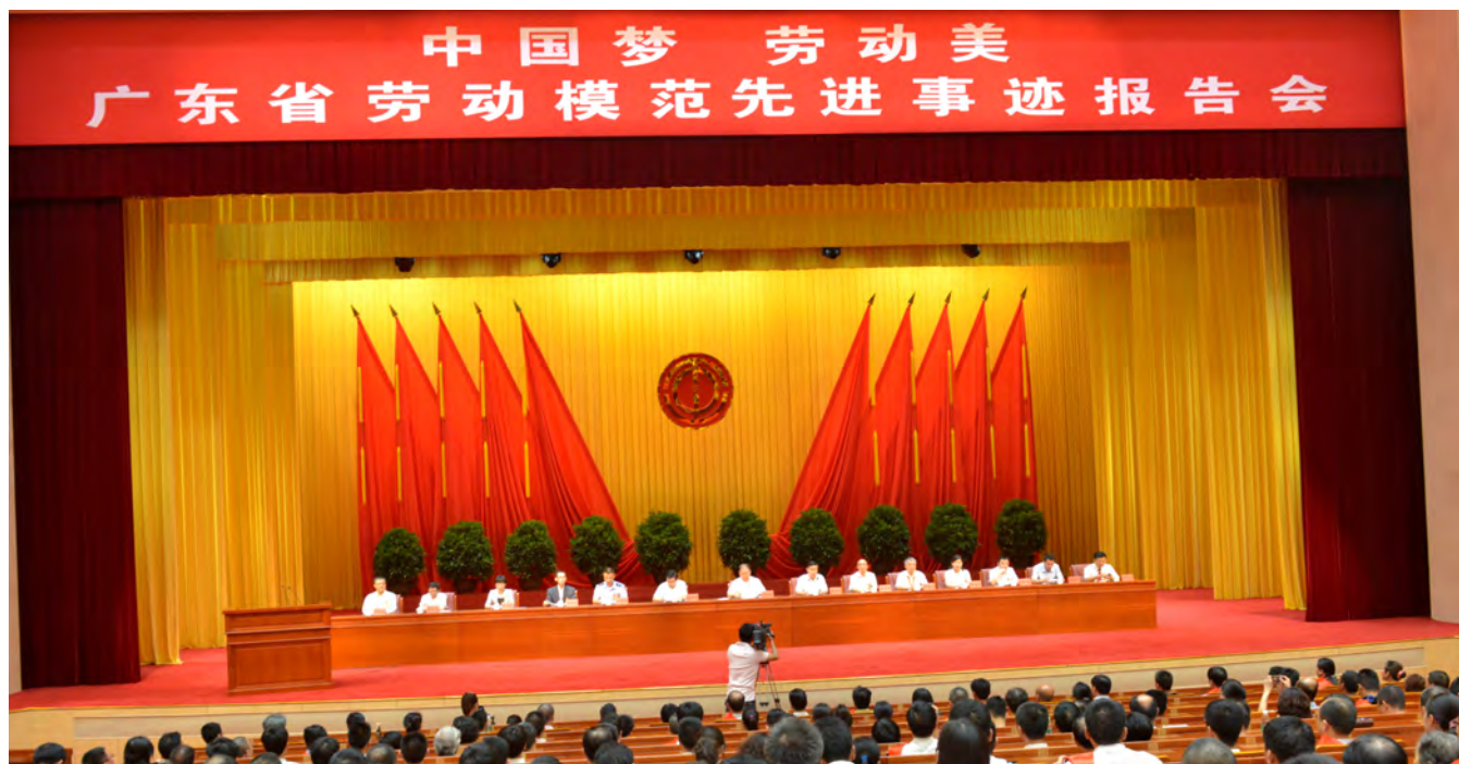
▲ 广东省劳动模范先进事迹报告会首场

5月29日上午，由广东省委宣传部、省总工会联合主办的“中国梦·劳动美”广东省劳动模范先进事迹报告团首场报告会在广州举行。