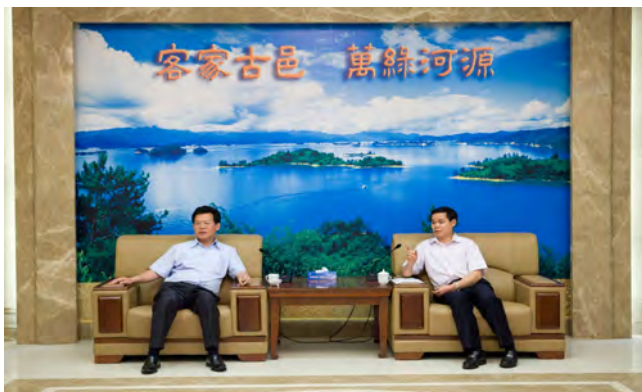
▲ 彭建文市长与省总工会常务副主席、报告团团长陈宗文致辞