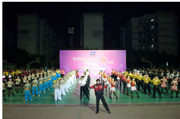
“快乐健身 你我同行”职工全健排舞比赛