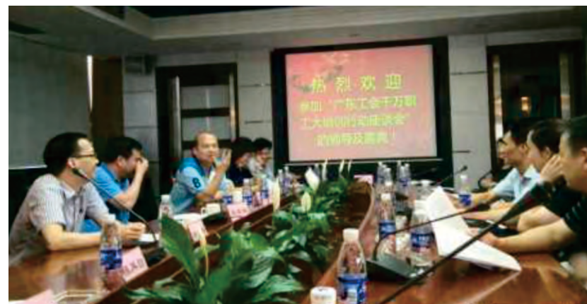
广东工会千万职工大培训行动座谈会，珠三角地市分管主席，宣教部长齐议职工培训