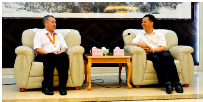
▲ 云浮市委书记王强与劳模嘘寒问暖