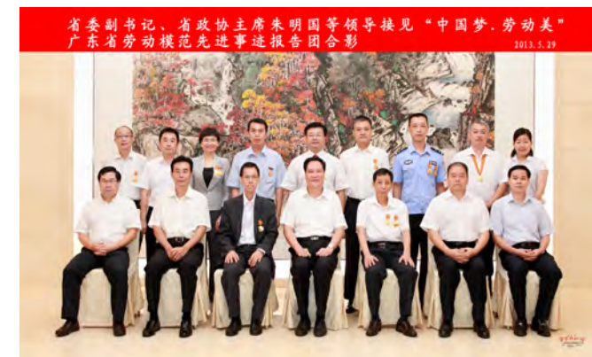
▲ 省委副书记、省政协主席朱明国等领导接见“中国梦·劳动美”广东省劳动模范先进事迹报告团合影