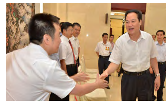
▲ 省委副书记、省政协主席朱明国会前接见劳模团成员