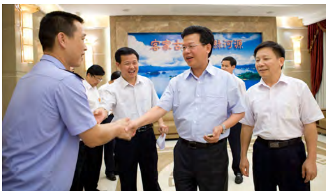
▲ 河源市人民政府彭建文市长接见劳模宣讲团成员