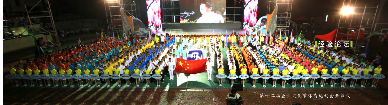
第十二届企业文化节体育运动会开幕式

总之，只有用先进思想、优秀文化以及健康向上的职工文化活动，活跃和丰富职工的精神文化生活，满足职工多层次、多样化、多方面的精神文化需求，才能不断激发广大职工的劳动热情和创造活力，从而不断推进构建和谐企业的进程，促进企业又好又快发展。工会组织和工会工作者都应进一步提高认识，自觉增强使命感和责任感，把加强职工文化建设作为工会一项重要工作摆在重要位置，科学规划，扎实工作，求真务实，勇于实践，与时俱进，开拓创新，不断催开灿烂的职工文化之花，为云硫集团发展凝心聚力，为建设“双百云硫”做出更大的贡献。