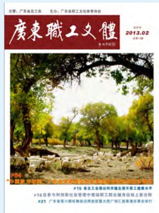
《额济纳的秋天》