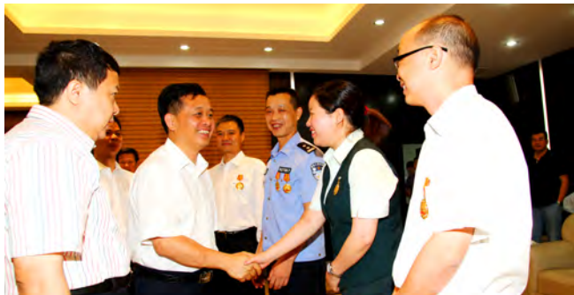
▲ 云浮市委书记王强与劳模代表团成员亲切会面