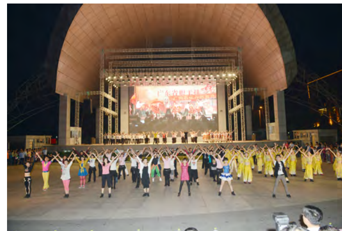
240名师生共舞《全健排舞大家跳》