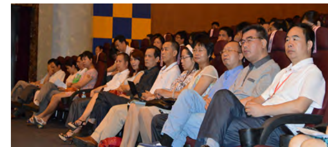
▲ 肇庆市各级工会干部和职工群众代表参加报告会