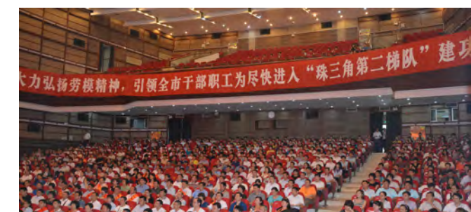
▲ 劳动模范代表和职工代表约1000人听报告