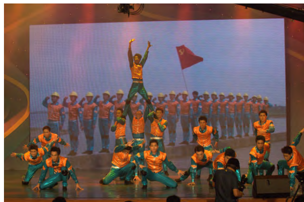
舞蹈《铁军赞歌》获“国企献礼”——广东省国资委系统纪念建党90周年舞蹈比赛中一等奖