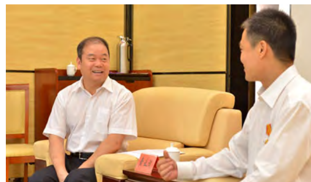
▲ 省人大副主任、省总工会主席黄业斌和劳模代表亲切交谈