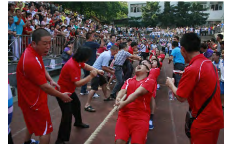
第十二届企业文化节体育运动会拔河比赛现场

多年来，公司通过实施“文化兴企”战略，把文化建设渗透到企业管理的每个角落，培育形成了独特的企业文化。“献身水电、奉献社会”的企业价值观，“四个一百（百亿产值、百亿资产、百万装机、百年企业）”的中长期发展目标，“团结协作、艰苦奋斗、开拓求实、争创效益”的企业精神，“安全、优质、文明、高效、廉洁、和谐”的工程方针，“力争上游、永不服输”的工作作风，“做精品工程、交满意答卷”的社会承诺，“招之即来、来之能战、战之能胜”的品牌形象，“做强、做大、做优、做久”的企业愿景，构成了公司企业文化的精髓，推动企业健康稳定快速发展的内在动力。